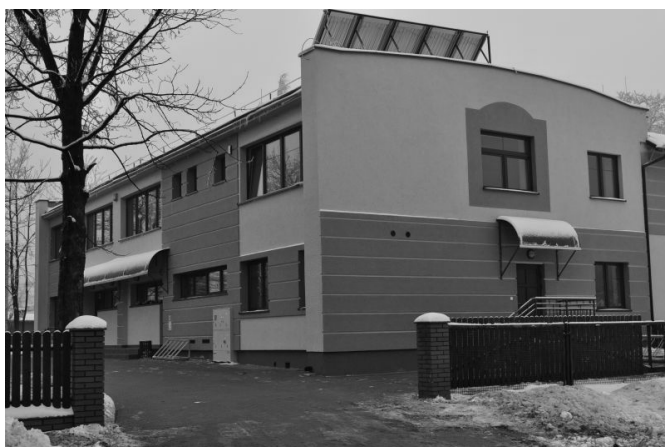
Fot. 3. Projekt: „Adaptacja budynku i rozbudowa przedszkola w Alwerni” – inwestycja o charakterze punktowym w negatywny sposób wpływająca na otaczającą przestrzeń