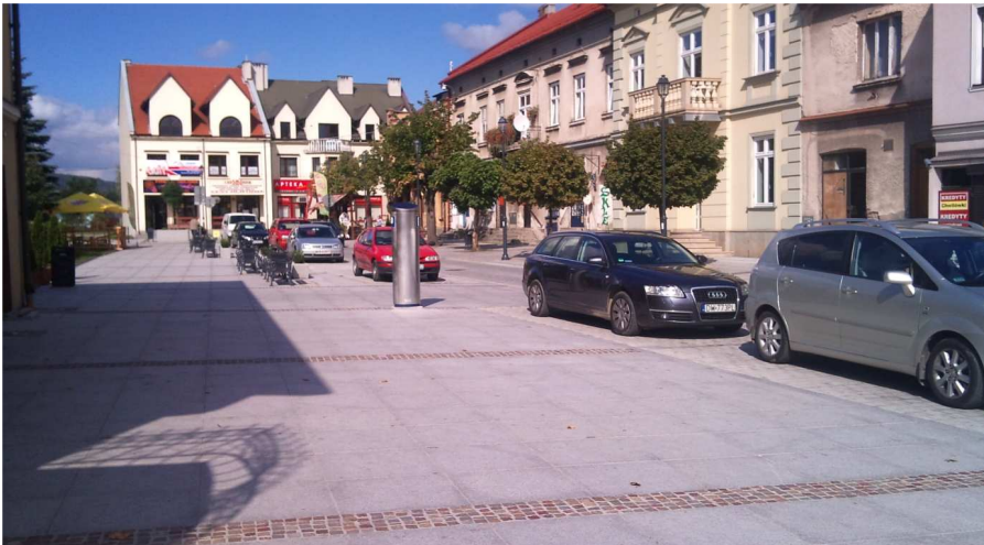
Fot. 1. Krzeszowice – fragment wschodniej części rynku po rewitalizacji. Uzupełnienia wymaga eksponowana północna pierzeja rynku

W przypadku Krzeszowic z pewnością zmiany w obrębie centrum, rewitalizacja rynku, modernizacja obiektów uzdrowiska, uporządkowanie terenów zielonych na styku z parkiem i wzdłuż potoku Krzeszówka, stanowią ważny element przywracania atrakcyjności tego rejonu (fot. 1). Wydaje się jednak, że miasto nie wykorzystało jeszcze w pełni potencjału tych zmian i kontynuacji dalszych przemian w kierunku północnym i południowym oraz czytelnym powiązaniu z zespołami mieszkaniowymi we wschodniej części miasta. Strefa przy dworcu kolejowym od strony trasy na Katowice i Tenczynek wymaga również jakościowych zmian struktury zagospodarowania.