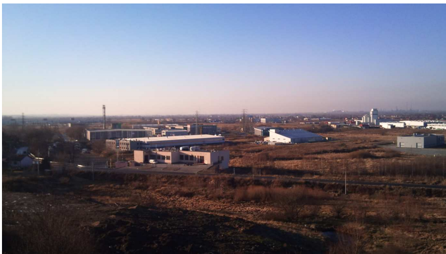
Fot. 3. Niepołomice – zachodnia część strefy przemysłowej