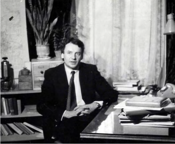
Fot. 2. Prof. Andrzej Suliborski w pracy (1987 r.)

Za największe osiągnięcie naukowe A. Suliborskiego w zakresie studiów regionalnych należy uznać dopracowanie metodologii analizy regionalnej, polegającej na odejściu od ujęcia monograficznego na rzecz badania najważniejszych problemów charakterystycznych dla regionu i ich wyjaśnianiu na podstawie celowo wybranych studiów przypadków.