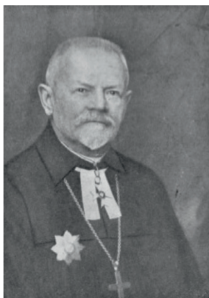
Fot. 5. Ks. bp Juliusz Bursche (1862-1942) – zwierzchnik Kościoła Ewangelicko-Augsburskiego w Polsce