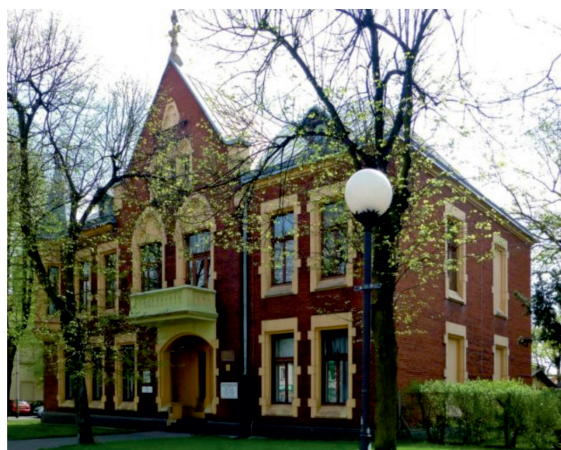
Fot. 1. Budynek domu parafialnego