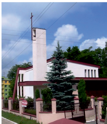
Fot. 7. Siedziba obecnej parafii ewangelicko-augsburskiej p.w. Opatrzności Bożej w Zgierzu