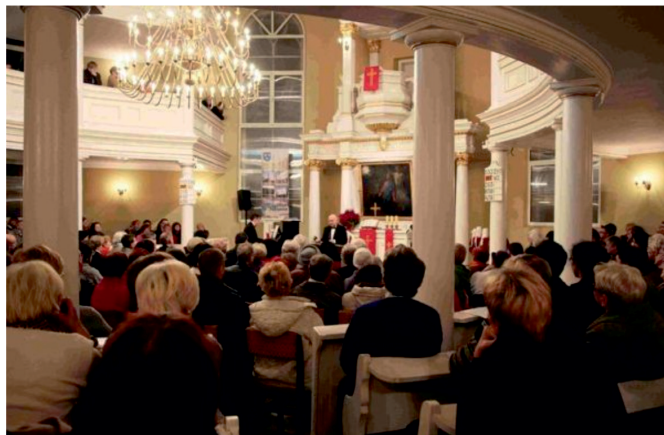
Fot. 3. Koncert z cyklu „Muzyka Świata w Pabianicach” w pabianickiej parafii luterkańskiej

Oprócz swej podstawowej działalności religijnej, parafia jest rozpoznawana w skali miasta, jak i całego regionu jako animator życia kulturalnego, organizator rozmaitych tematycznie konferencji, odczytów, wystaw i wydawca czasopisma kulturalnego – Kołowrotek , a przede wszystkim szeroko opisywanych i chętnie odwiedzanych koncertów. Wszystkie te działania „malują wizerunek miasta Pabianic” w wyjątkowo korzystnych barwach.