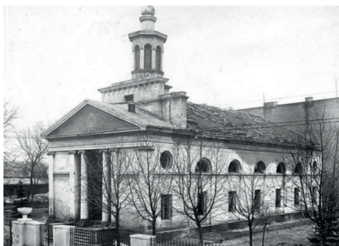
Fot. 4. Budynek parafii ewangelicko-augsburskiej w Zgierzu przy ul. Długiej, zbombardowany w 1939 roku

Zgierski Kościół parafialny został wzniesiony na planie podłużnego prostokąta, okna w elewacjach bocznych wykonano w dwóch kondygnacjach. Fasadę świątyni ozdabiał portyk wsparty na kolumnach, a wieńczyło go belkowanie. Uroczyste poświęcenie kościoła odbyło się we wrześniu 1826 roku.