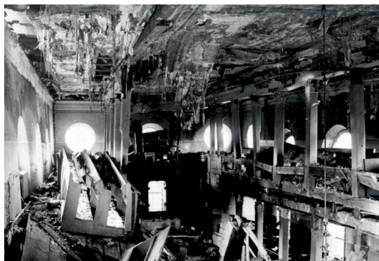
Fot. 6. Zbombardowane wnętrze parafii ewangelickiej w Zgierzu