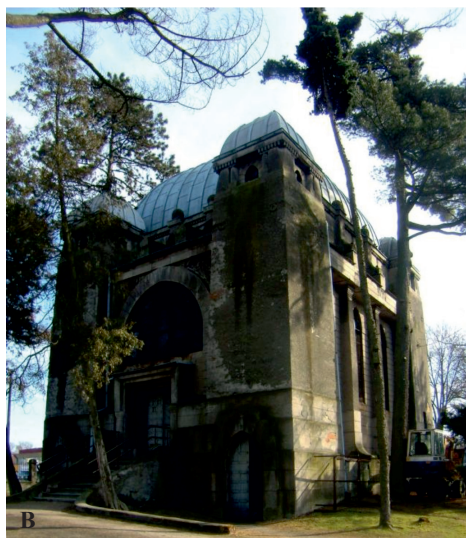
Fot. 2. Mauzoleum rodu Kindlerów

A – z początku XX wieku, B – współcześnie