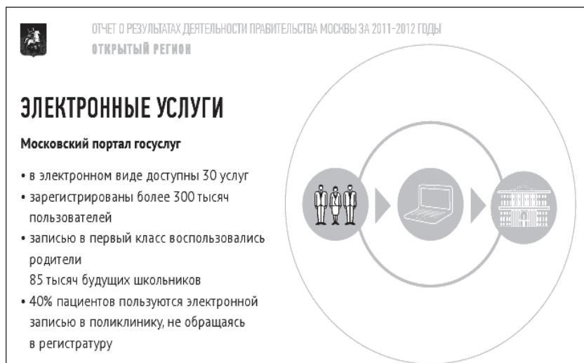
Рис. 3. Отчет о результатах деятельности правительств Москвы за 2011–2012 годы. Электронные услуги