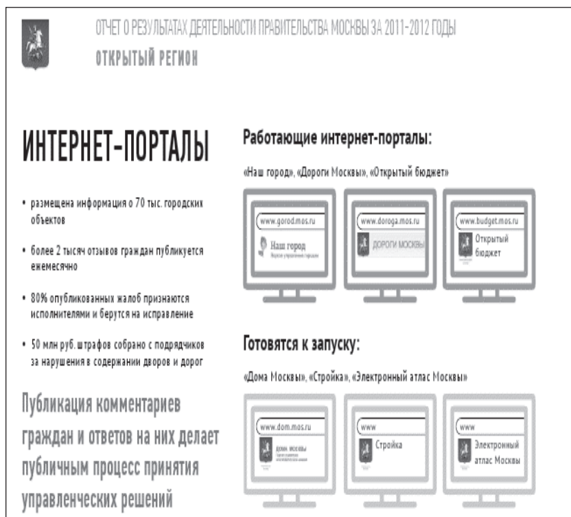
Рис. 2. Отчет о результатах деятельности правительств Москвы за 2011–2012 годы. Интернет-порталы