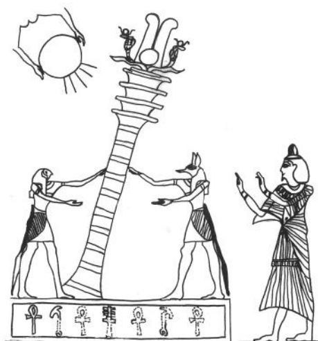
Rytuał podniesienia kolumny dzed . Widoczne na rysunku przerywane kontury symbolu ank są najprawdopodobniej rekonstrukcją niewidocznych fragmentów symbolu. rys. M. Przybyłek, za: A. Niwiński, Bóstwa, kultury i rytuały starożytnego Egiptu , Warszawa 2004, s.273.