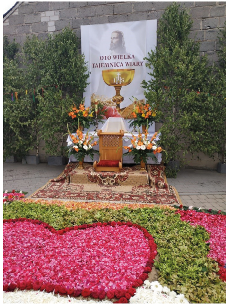
Ryc. 4. Jeden z ołtarzy wraz z dywanem, gotowy na procesję eucharystyczną

Inne przedmioty, które są istotne w kulminacyjnym czasie święta, to atrybuty procesji: krzyż, feretrony chorągwie, poduszki, baldachim, szarfy (Brdów AK) (ryc. 5), jak też ozdoby domów, gdyż na balkonach, w oknach też powywieszane Matkę Boską, Pana Jezusa (Spycimierz SP). Zaliczą się tu również stroje asysty, jak na przykład haftowane, piękne bluzki ze spódnicami są we wzorach czerwonych, spódniczki – białych i zielonych (Brdów AK), kobiece, męskie, dziecięce i alby, krojone, szyte, haftowane przez parafianki (ryc. 5) bądź – w przypadku elementów wełnianych – zamawiane u krawców z zewnątrz (Spycimierz MP). Te stroje są w kościele, uszyte specjalnie dla asyst, żeby było pięknie (Człopy ŁŁ). Do listy przedmiotów dodać należy stroje komunijne dziewczynek sypiących kwiaty lub odświętne sukienki dziewczynek będących przed Pierwszą Komunią, mundury orkiestry i instrumenty, staranne ubrania parafian i gości itp. Zaliczyć je trzeba do SEMIOFORÓW, i wraz z analizowanymi wyżej atrybutami święta – do podtypu WYOBRAZEŃ w typologii K. Pomiana, czyli malowanych, haftowanych, tkanych, wycinanych, rytých, układanych z różnych materiałów, komponowanych z ludzi i przedmiotów, jak w widowiskach [...], komponowanych też z roślin, jak w ogrodach 35 . Użyte przez K. Pomiana słowa haft, układanie z różnych materiałów, kompozycje z roślin zdają się wprost odnosić do strojów asysty i scenografii spycimierskiego święta.