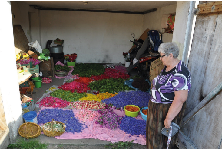
Ryc. 1. Przechowywanie kwiatów zebranych na dywany. Przeddzień Bożego Ciała 26

duże znaczenie, do ich analizy proponuję zastosować teorię K. Pomiana 22 , który ujęcie semiotyczne przeniósł do badań historii, uwzględniające znakowy charakter przedmiotów jako zjawisk posiadających stronę rzeczową i znaczenie. K. Pomian w swojej słynnej i cenionej teorii wyznaczył pięć jednorodnych funkcjonalnie klas przedmiotów, nazwając je CIAŁAMI, ODPADAMI, RZECZAMI, SEMIOFORAMI oraz MEDIAMI 23 . RZECZY według niego „są to maszyny, narzędzia, przyrządy, środki transportu, pomieszczenia, ubiory, uzbrojenie, pożywienie, leki” 24 , a więc stosowane przez spycimierzan narzędzia i środki transportu mieszczą się w tej kategorii. Jak pisze K. Pomian, pierwotną funkcją RZECZY jest to, że ich „przeznaczeniem jest zmienianie wyglądu lub obserwowalnych właściwości bądź też lokalizacji innych przedmiotów” 25 . I również stwierdzimy, że grabki, miotły, szczotki będą służyły do zmiany wyglądu i właściwości drogi, poboczy, podwórek spycimierskich, zaś rower, traktor, ciągnik – do zmiany lokalizacji obiektów i ludzi.