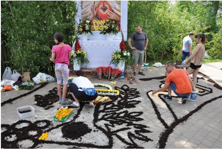
Ryc. 3. Przygotowanie ołtarza i dywanu przez mieszkańców wsi Zieleń. Ranek w Boże Ciało

rębną klasę funkcjonalną, do której należy wszystko, co ludzie znajdują w swoim otoczeniu” 28 – jak spycimierzenie starają się to, co da im natura, przetworzyć w swoje dzieła. „Surowce, dzikie rośliny i zwierzęta, żywioly, takie jak woda, ziemia, powietrze i ogień [...], nim zostaną przetworzone przez człowieka, nie mają żadnego pierwotnego przeznaczenia” 29 . Wyliczenie to, po pominięciu zwierząt i ognia, w pełni odpowiada dziełu spycimierskiemu.