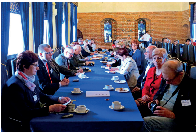
Ryc. 6. Przedstawiciele towarzystw regionalnych z terenu województwa łódzkiego podczas obrad sejmikowych, 16.04.2016