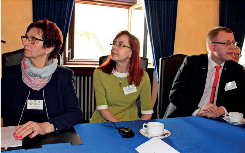
Ryc. 1. Organizatorzy I Sejmiku Stowarzyszeń Regionalnych Województwa Łódzkiego w Uniejowie, 16.04.2016

wojewódzkiej w Uniejowie. Trud organizacyjny wzięły na siebie Towarzystwo Przyjaciół Uniejowa i Towarzystwo Przyjaciół Zduńskiej Woli (ryc. 1) 3 .