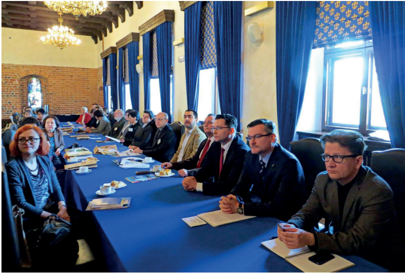
Ryc. 5. Zaproszeni goście na uniejowski sejmik, 16.04.2016