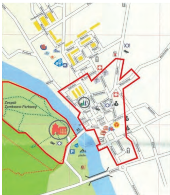
Ryc. 3. Strefa ochrony konserwatorskiej „B” w mieście Uniejów z uwzględnieniem budynków zamku oraz kościoła kolegiackiego

Pomimo odmiennej kolejności zagadnień zawartych w LPR, naturalnym pozostaje początkowe wytyczenie obszaru rewitalizowanego. W przypadku Uniejowa jego zasięg niemal kompletnie zawiera się w strefach ochrony konserwatorskiej wymienionych w ZSUiKZP 35 . W obrębie miasta zlokalizowano strefę „B” 36 obejmującą zarówno historyczny układ przestrzenny, jak i zespół zamkowy (ryc. 3). LPR wyposażony został także w wykaz wszystkich obiektów oficjalnie uznanych za zabytki dziedzictwa materialnego według możliwych ewidencji i rejestrów.