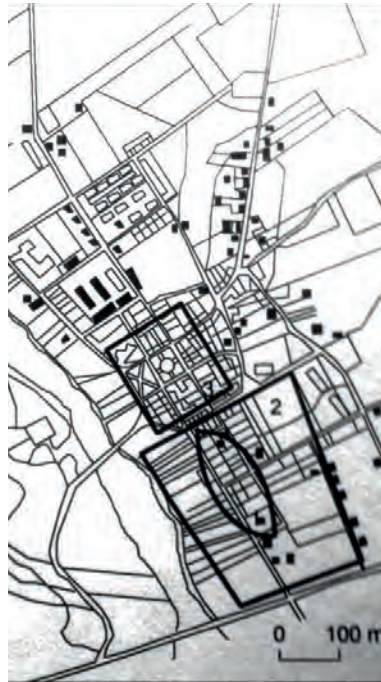
Ryc. 4. Współczesny plan miasta Uniejów z zaznaczeniem: (1,2) dawnej osady targowej z placem, (3) miasta lokacyjnego (por. ryc. 4.)

są przede wszystkim poprzez występowanie tzw. rozlewania się zabudowy na terenach sąsiadujących z pierwotną tkanką miejską. Konsekwencją takiego stanu rzeczy bez wątpienia pozostają wtórne utrudnienia w dostosowaniu lokalnej polityki przestrzennej i egzekwowaniu warunków dotyczących zabudowy. W efekcie mamy do czynienia z wyraźnym marginalizowaniem, a wręcz pominięciem ewolucji obszarów staromiejskich, bądź centralnych – śródmiejskich, co z kolei determinuje ich przyspieszoną degradację 37 . Pierwszeństwa dzielnic śródmiejskich i jego elementów w ewentualnym procesie rewitalizacji, upatruje się również w ich ewidentnej kontrastowości na tle pozostałej struktury przestrzennej miasta 38 , motywowanej między innymi zróżnicowaniem form zabudowy 39 . Wszystkie powyższe przesłanki teoretyczne doskonale wpisują się w uwarunkowania decydujące o zasięgu terytorialnym LPR dla Uniejowa, który obejmuje zdecydowaną większość komponentów historycznego rozplanowania (ryc. 4).