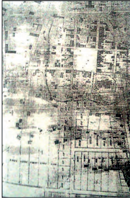
Ryc. 2. Uniejów, plan miasta z 1823 r.