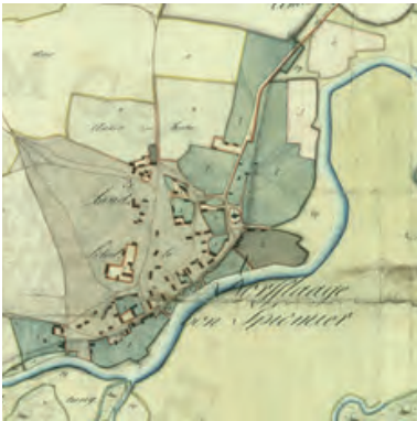
Ryc. 4. Plan wsi Spicymierz z 1804 r. (przed utworzeniem majoratu)