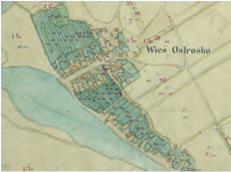
Ryc. 6. Plan wsi Ostrowsko z 1839 r.

Dalsze procesy przekształceń sieci osadniczej w dobrach rodziny Tollów powiązane były z uwłaszczeniem chłopów. Doszło w tym okresie do kolejnych zmian rozplanowania wsi 81 . Prowadzone odgórnie procesy komasacyjno-separacyjne rozłogów, regulacje siedlisk oraz parcelacje majątków folwarcznych miały na celu częściową lub całkowitą transformację układów ruralistycznych. Wsie poregulacyjne przyjmowały najczęściej charakter rzędówek, zwykle z jedną osią siedliskową i jednostronną zabudową. W wielu przypadkach nowe struktury morfologiczne w postaci tzw. wsi sznurowych z indywidualnym, pasmowym układem rozłogów zastępowały dawne, zwarte układy ulicówek i owalnic o metryce średniowiecznej z niwowym układem gruntowym. Przykładem takiej formy transformacji może być wieś Ostrowsko (ryc. 6 i 7). Przykładami nowych układów kolonijnych powstałych w wyniku parcelacji gruntów folwarcznych mogą być natomiast wsie: Spycymierz Kolonia, Orzeszków Kolonia i Wielenin Kolonia 82 .