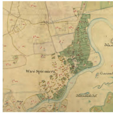
Ryc. 5. Plan wsi Spicymierz z 1839 r. (po utworzeniu majoratu i regulacji)