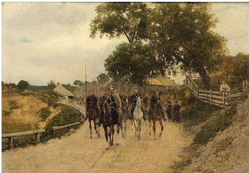
Ryc. 6. Ryszard Okniński – obraz Kawaleria powstańcza 1863 roku