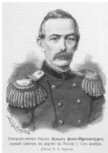
Ryc. 4. Konstanty Karłowicz Klodt von Jürgensburg