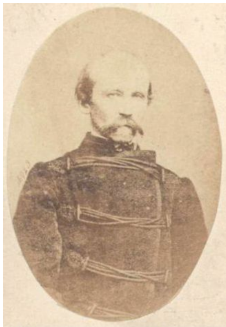
Ryc. 2. Generał Edmund Taczanowski