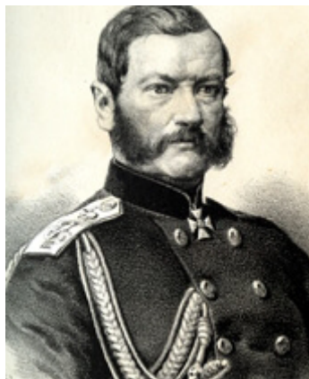
Ryc. 3. Mikołaj von Baumgarten