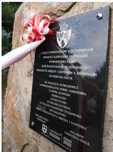
Ryc. 9. Tablica upamiętniająca potyczkę pod Czepowem w Wilamowie

Większość z tych ofiar spoczęła na cmentarzu w Wilamowie. Wśród pochowanych znajduje się również Rosjanin, który zginął tego dnia od polskiej kuli lub szabli 35 .