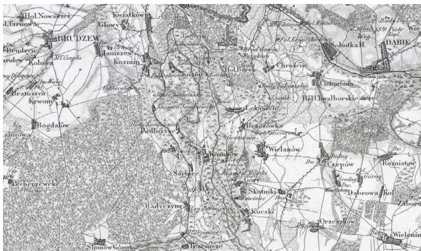
Ryc. 8. Miejsce bitwy pod Czepowem