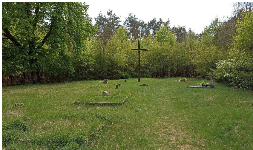
Ryc. 1. Widok cmentarza ewangelicko-augsburskiego w Uniejowie w maju 2022 r.

najprawdopodobniej właśnie w okresie II wojny światowej, później wraz ze zniknięciem ludności niemieckiej cmentarz pozostawał nieużywany. Po zakończeniu działań wojennych nekropolia uległa dewastacji i aktom wandalizmu, wskutek których zniszczone zostały znajdujące się tam nagrobki i miejsca pochówku.