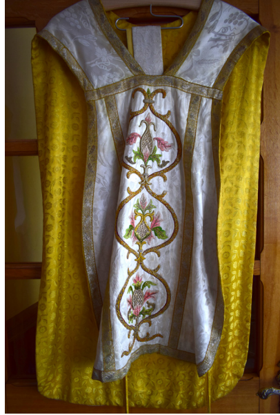
Ryc. 11 i 12. Ornat biały z XX w. Zdjęcie lewe przedstawia tył szaty, zdjęcie prawe przód