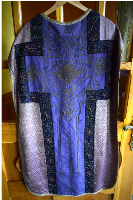
Ryc. 13. Ornat fioletowy z XIX w.