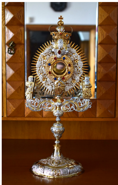
Ryc. 2. Monstrancja z 1752 r.

nią postać Matki Boskiej Niepokalanej. Na rewersie glorii widnieje tarcza z drobnym ornamentem roślinnym. Powyżej prostej puszkę znajdują się półpostać Boga Ojca i Oko Opatrzności. Nad całością umieszczona jest niewielka korona z krzyżem 16 .