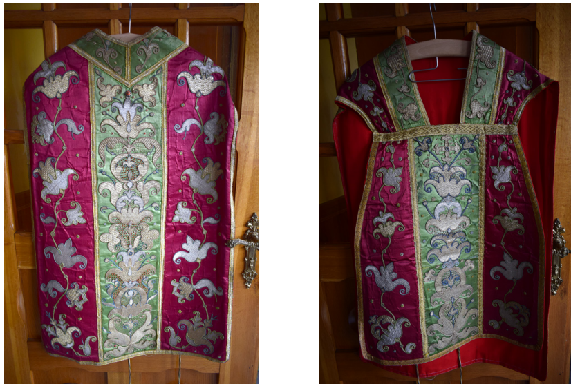
Ryc. 4 i 5. Ornat czerwony z XVIII w. Zdjęcie lewe przedstawia tył szaty, zdjęcie prawe przód

dzwonka i granatu na długiej łodydze. Haft w tej części jest także płaski, wykonany nićmi złotą i srebrną. Przy kolumnie widoczna jest złota, klockowa koronka. Miejscami tkanina została nieco poprzecierana 21 .