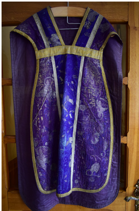
Ryc. 8. Ornat fioletowy