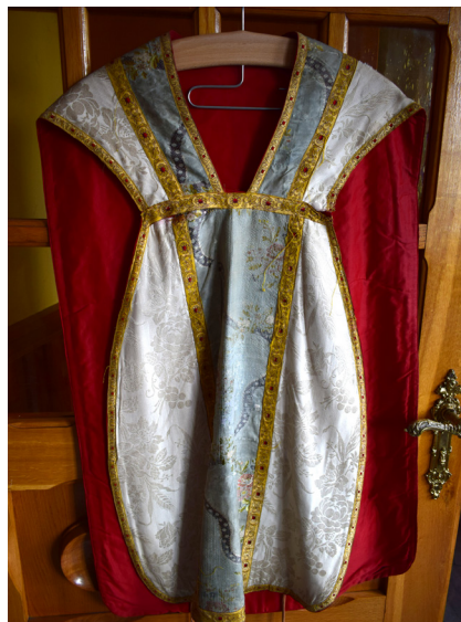
Ryc. 9 i 10. Ornat biały. Zdjęcie lewe przedstawia tył szaty, zdjęcie prawe przód

Ornat biały – współczesny ornat z drugiej połowy XX w. (ryc. 11 i 12). Wykonany został z naturalnego jedwabiu, zdobionego haftem. W centralnej części ma haftowaną postać Matki Boskiej w otoczeniu prostych ornamentów oraz haftowanych kwiatów przypominających osty. Boki kolumny oraz brzegi laminowane są złotą taśmą. W dokumentacji parafii pojawia się rozbieżność datowania, gdyż jeden z opisów wskazuje, że jest to szata pseudobarokowa z I połowy XIX w., być może nowe datowanie wynika z późniejszych przeróbek tej szaty 24 .