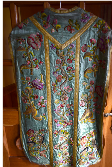
Ryc. 6 i 7. Ornat zielony. Zdjęcie lewe przedstawia przód szaty, zdjęcie prawe tył