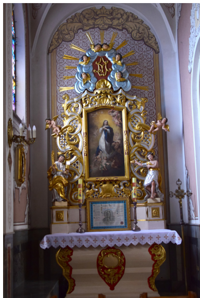
Ryc. 14 i 15. Ołtarze boczne. Zdjęcie lewe przedstawia ołtarz Przemienienia Pańskiego, zdjęcie prawe ołtarz Matki Boskiej Niepokalanej.