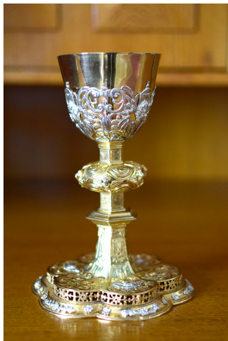
Ryc. 3. Kielich z XVII w.

Warto wyróżnić także pochodzący z początku XVII w. kielich (ryc. 3). Renesansowe naczynie wykonano ze złożonego srebra w technice odlewu i trybowania. Całość jest wielkości 21 × 15,5 cm. Stopa kielicha ma kształt sześciodzielnej rozety, jest płaska z ażurowym cokołem zdobionym kwiatami lili i rozetami. Na brzegach widoczne są pojedyncze kwiatki z zauważalnymi brakami kilku z nich. W niektórych miejscach na płaszczu stopy znajdują się zdobienia w kształcie liści i owoców, a także plakietki uskrzydłych głów anielskich. Na podstawie widoczna jest punca w postaci lili heraldycznej oraz inicjału „H”. Zgrubienie na trzonie w kształcie spłaszczonej kuli ozdobione zostało kwiatami ułożonymi na sześciu rantach, między którymi znajduje się putta. Pod nodusem jest sześcioboczny talerz. Na pierścieniach sześciodzielnych widać napis „IHESUS CHRISTVS”. Zwieńczeniem trzonu jest koszyczek z trzema uskrzydłonymi anielskimi głowami i wolutowymi splotami, w które ujęto czarę o tulipanowym kształcie 18 .