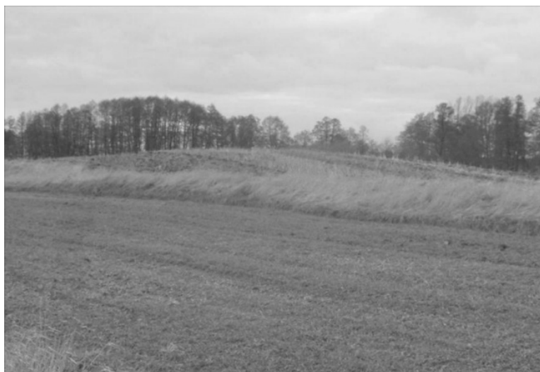
Ryc. 2. Współczesna fizjonomia pozostałości grodziska w Spycimierzu z poziomu gruntu

Oddział w Łodzi 41 . Oprócz analiz teledetekcyjnych wykonano także prospekcję geofizyczną. Pomiary magnetyczne pozwoliły przede wszystkim na zarejestrowanie anomalii, które wiązać należy ze strukturami starszego założenia grodowego. Pomiary elektrooporowe ujawniły natomiast anomalie związane z obiektem młodszego pochodzenia. Co istotne, badania pozwoliły wyeliminować przypuszczenia o istnieniu osadnictwa otwartego, związanego z grodem, w bezpośredniej jego bliskości. Obserwacje reliktyw grodziska wykonane przez autora wskazują na znaczące zniszczenia obiektu w ostatnich latach związane z sukcesywnie wykonywaną w jego obrębie działalnością rolniczą (ryc. 2).