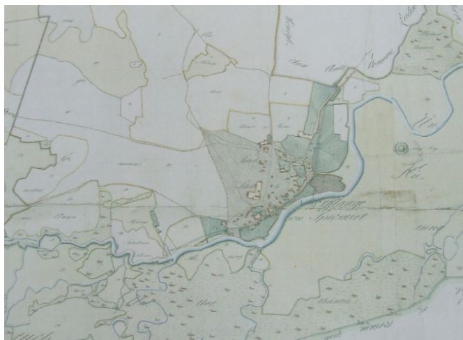
Ryc. 4. Plan Spycimierza z 1804 r.

wy, co doskonale prezentuje załączony plan z 1848 r. (ryc. 5) 52 . Nastąpił rozwój przestrzenny wsi w kierunku zachodnim na obszarach, które do tej pory nie były zagospodarowane ze względu na gorsze warunki środowiskowe, niekorzystne z punktu widzenia działalności rolniczej. Dostrzec można także rozwój zabudowy w kierunku północnym, wzdłuż drogi prowadzącej w rejonie kościoła, równoległe do meandru rzecznego.