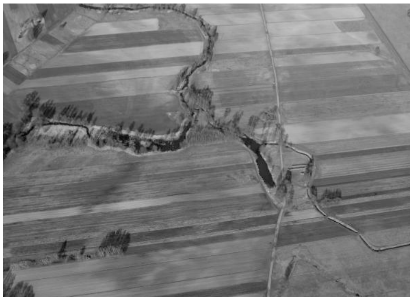
Ryc. 1. Współczesne zdjęcie lotnicze okolic Spycimierza z oznaczeniem relikwów grodziska

Gród pierścieniowy przestał funkcjonować zapewne w początkach XIV stulecia. Zidentyfikowane ślady katastrofy pożarowej mogą sugerować przywołane wcześniej wydarzenie historyczne dotyczące najazdu Krzyżaków w 1331 r., którzy – jak potwierdzają źródła pisane – spalili gród i pobliskie osady. W zachodniej części zniszczonego uprzednio wału grodowego I fazy usypano w 1 połowie XIV w. stożkowaty kopiec, stanowiący podstawę pod budowlę obronną typu wieżowego, której pozostałości nie stwierdzono. Wiadomo natomiast, że nasyp grodu II fazy otoczony był drewnianą konstrukcją oraz fosą. Luźne znaleziska archeologiczne pozwalają datować rozwój grodu na późne średniowiecze. Było to zapewne związane z czasowym przejściem osady obronnej przez świecki ród możnowładczy Ogonów, którzy być może planowali stworzyć tu swoją siedzibę 40 . Dzięki pracom poszukiwawczym ujawniono pozostałości faszyny umacnianej kamieniami z drewnianymi obramieniami. Udało się w ten sposób zrekonstruować przebieg dawnej grobli lub drogi prowadzącej od Spycimierza do przeprawy na Warcie w kierunku Uniejowa (ryc. 3). W 2014 r. przeprowadzono kolejną serię nieinwazyjnych badań na tym obszarze w ramach szerszego projektu naukowego poświęconego grodziskom centralnej Polski. Interdyscyplinarne badania realizowane były pod auspicjami Stowarzyszenia Naukowych Archeologów Polskich,