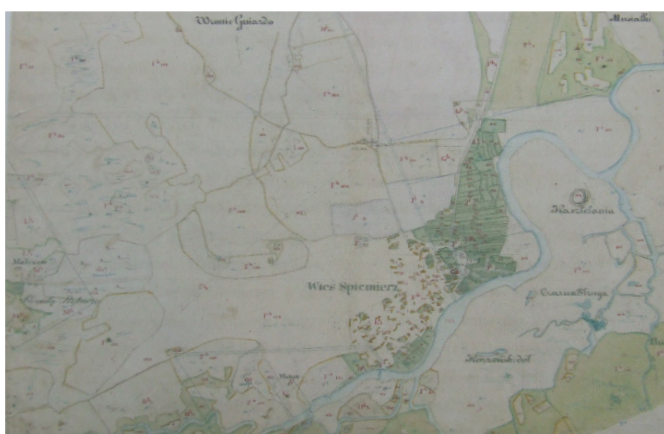
Ryc. 5. Plan Spycimierza z 1848 r.