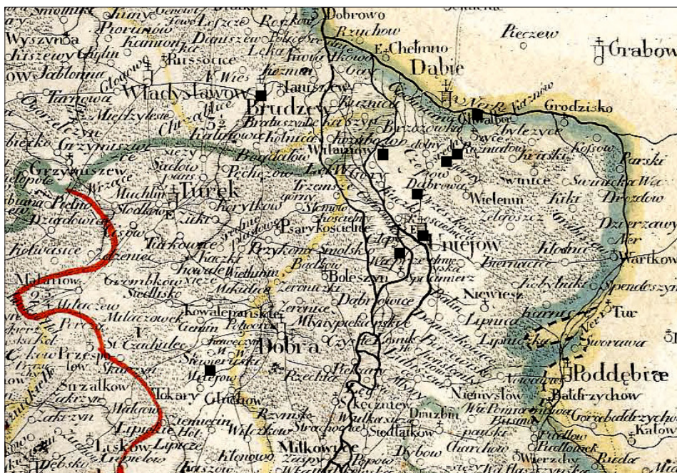
Fot. 4. Okolice Uniejowa ok. 1826 r. na mapie województwa kaliskiego