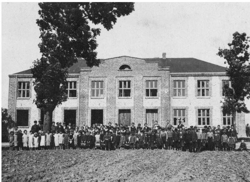
Ryc. 2. Szkoła powszechna w Niewieszu, spalona we wrześniu 1939 r., lata 30. XX w.

Do 1939 r. w miejscowości istniała gminna, „ruchoma” biblioteka, posterunek Policji Państwowej, szkoła powszechna, siedziba zarządu gminy, Kasa Oszczędnościowa „Ner-Warta” (wcześniej Kasa Gminna Pożyczkowo-Oszczędnościowa), tartak pn. „Spółka leśna Szykier, Kolski i S-ka” 56 , a także działały organizacje społeczne (straż pożarna, Kółko Rolnicze, Koło Gospodyń Wiejskich, Liga Morska i Kolonialna, Związek Strzelecki, Stowarzyszenie Młodzieży Polskiej, Gminny Związek Rezerwistów i Byłych Wojskowych) i polityczne (Bezpartyjny Blok Współpracy