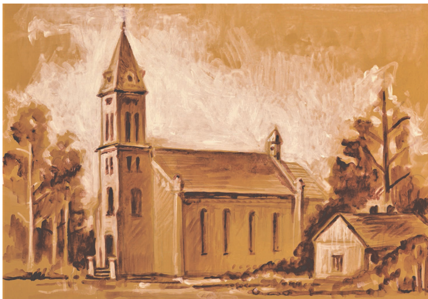
Ryc. 5. Kościół parafialny w Niewieszu spalony podczas działań wojennych w pierwszych dniach września 1939 r. i rozebrany przez niemieckie władze okupacyjne w 1940 r. Źródło: obraz autorstwa Pawła Duraja, znajdujący się w zbiorach parafii pw. Wszystkich Świętych w Niewieszu

W 1945 r. siedziba urzędu gminy została przeniesiona z powrotem do Niewieszu i zlokalizowana w dwóch barakach na rozparcelowanej ziemi byłego majątku. W okresie powojennym gmina zachowała przedwojenną przynależność administracyjną. Według stanu z dnia 1 lipca 1952 r. gmina składała się z 28 gromad: Balin, Biernacice, Borzewisko, Bronów, Bronówek, Dominikowice, Dzierżązna, Gibaszew, Grocholice, Józefów, Józefów Kolonia, Karnice, Kobylniki, Konopnica, Krempa, Ksawercin, Leśnik, Lipnica, Łęg Baliński, Niewiesz, Niewiesz Kolonia, Paulina, Polesie, Sempółki, Sędów, Szarów Księży, Wilczków i Wola Przedmiejska 73 . Jednostka została zniesiona 29 września 1954 r. wraz z reformą wprowadzającą gromady w miejsce gmin.