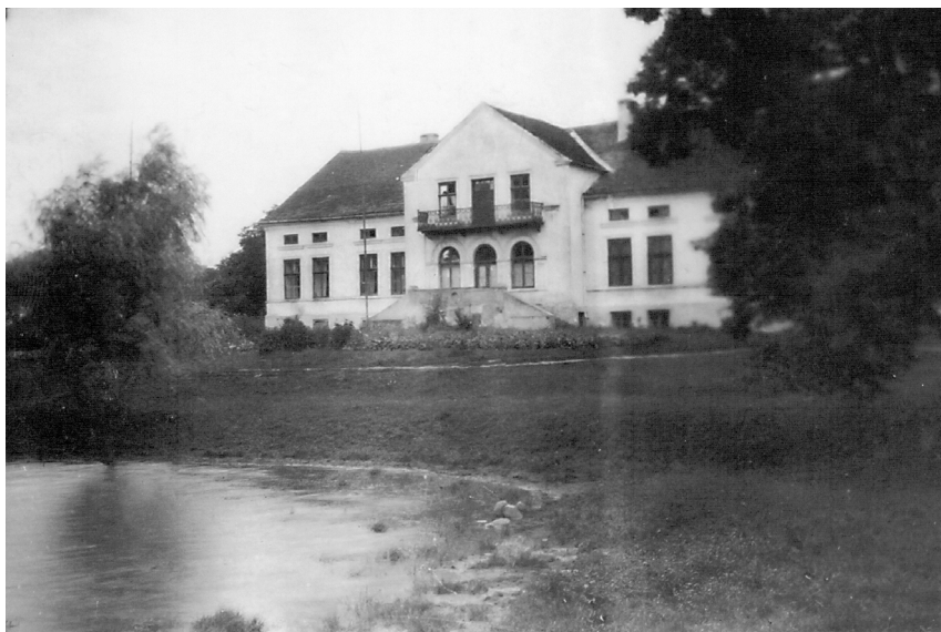
Ryc. 1. Dwór w Niewieszu, spalony we wrześniu 1939 r., lata 30. XX w.