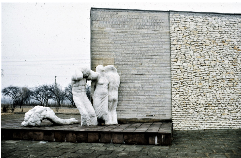
Ryc. 6. Pomnik pomordowanych przez żołnierzy Wehrmachtu mieszkańców z terenu gminy Niewiesz, znajdujący się przy trasie Poddębice–Uniejów (autorstwo: Michał Gałkiewicz)

zachodu z Grocholicami i Sempółkami, a od północy z wsiami Kobylniki i Szarów. Dwie ostatnie wspomniane miejscowości oddziela od Niewiesza pas bagien potorfowych. W sąsiedztwie sołectwa znajduje się leśny rezerwat przyrody Napoleonów 89 (zwany również Dąbrową Napoleonów), zajmujący obszar 37,99 ha (akt powołujący podawał 38,63 ha). Utworzony został w 1995 r. w celu ochrony zespołu wiekowej dąbrowy świetlistej oraz boru mieszanego z bujnym runem, w którym występuje wiele gatunków roślin rzadkich i chronionych, w tym m.in. napastrnica zwyczajna, lilia złotogłów, podkolan biały, kostrzewa ametystowa i dzwonek szczeciniasty 90 . Rezerwat znajduje się na terenie Nadleśnictwa Poddębice.