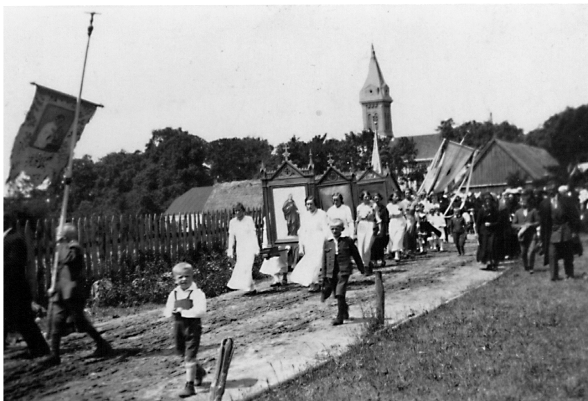
Ryc. 4. Procesja Bożego Ciała we wsi Niewiesz, lata 30. XX w. (w tle wieża kościoła parafialnego pw. Wszystkich Świętych)