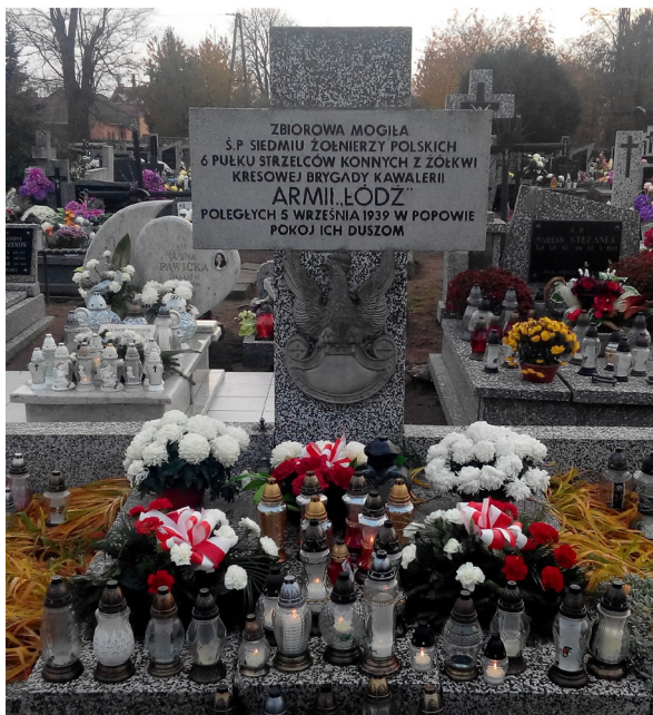
Ryc. 6. Mogiła siedmiu żołnierzy 6 psk na cmentarzu parafialnym w Pęczniewie

Dowódca batalionu saperów 30 DP mjr K. Ziebe zwrócił uwagę na narzucone tempo prac: „Ponieważ postęp dywizji naglił, prace musiały być wykonywane pod silną presją czasu, jeszcze przed ich zakończeniem pojazdy zostały ostrożnie przerzucone na drugą stronę” 115 .