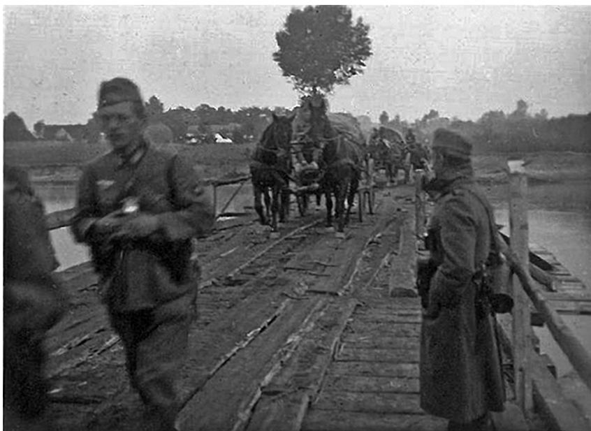
Ryc. 5. Żołnierze Wehrmachtu przekraczają zdobyty most łączący Popów z Miłkowicami. W tle zabudowania Miłkovic

Jak wspominał anonimowy żołnierz 3 kompanii 6 batalionu km mot.: „Okopaliśmy się na paśmie wzgórz i tak spędziliśmy noc. Do tego czasu saperzy naprawili most, tak że mogły podążać za nami nasze pojazdy” 89 .