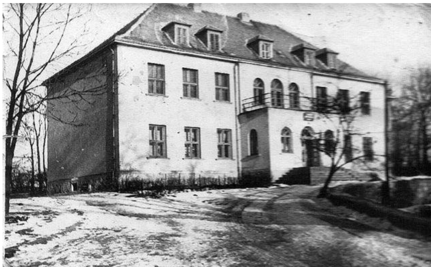
Ryc. 2. Budynek szkoły rolniczej w Popowie. Z widocznego balkonu rtm. J. Wilczyński dostrzegł nadciągającą kolumnę nieprzyjaciela