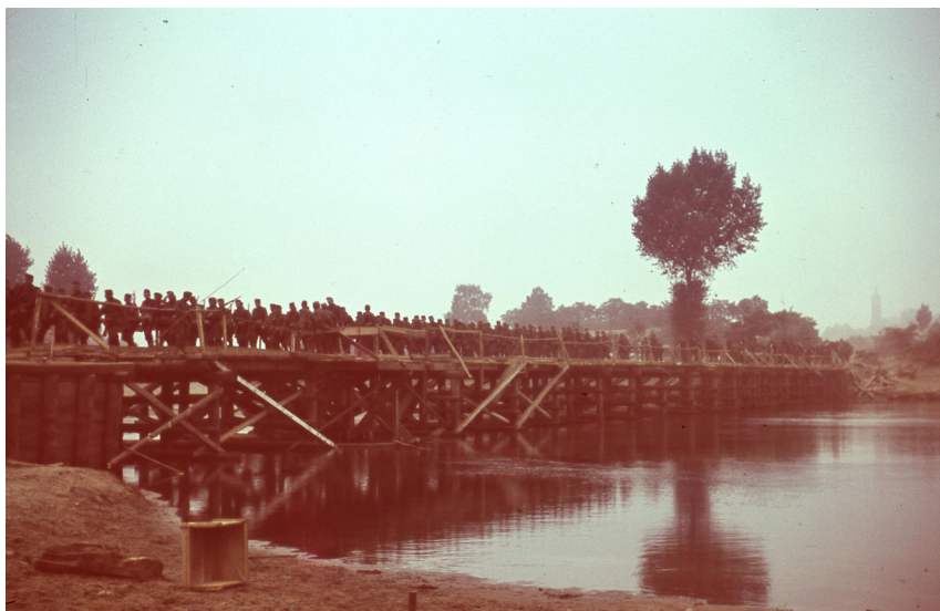
Ryc. 1. Most łączący Popów z Miłkovicami. W tle kościół w Miłkovicach, most przekraczają żołnierze Wehrmachtu z prawdopodobnie 213 DP