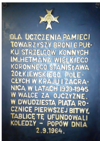
Ryc. 7. Tablica ufundowana przez weteranów 6 psk w 25 rocznicę bitwy pod Popowem, wisząca w kościele parafialnym w Pęczniewie