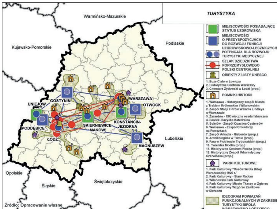
Ryc. 2. Koncepcja powiązań funkcjonalnych w obszarze turystyka

i aktualizowanych strategii rządowych i wojewódzkich, jak również punkt odniesienia dla lokalnych strategii rozwoju oraz strategii rozwoju obszarów funkcjonalnych, obejmujących w szczególności obszary metropolitalne Warszawy i Łodzi 7 .