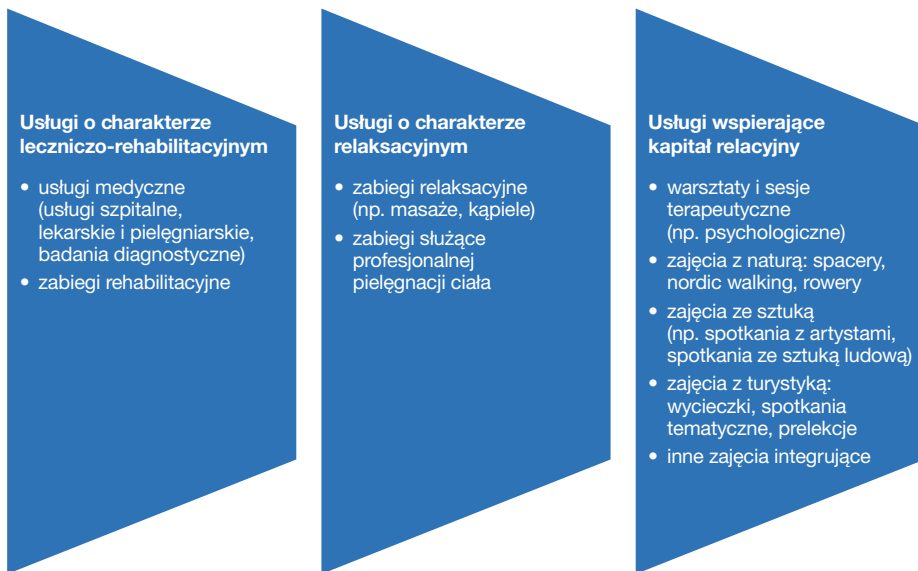
Ryc. 3. Paleta potencjalnych usług oferowanych przez ośrodki Pasma uzdrowiskowo-wypoczynkowego Uniejów–Poddębice–Rogóźno

układów uzdrowiskowo-wypoczynkowych 13 posiadających największy potencjał rozwojowy, które mają odgrywać decydującą rolę w budowaniu zróżnicowanej i komplementarnej oferty leczniczej, profilaktycznej i turystyczno-wypoczynkowej. Ze względu na istniejące zasoby, doświadczenie oraz dotychczasową dynamikę zmian szczególną rolę przypisano Pasmu Uniejów–Poddębice–Rogóźno. Posiada ono bowiem predyspozycje do „zbudowania” kompleksowej oferty adresowanej do rodzin z dziećmi, osób dorosłych aktywnych zawodowo i fizycznie oraz osób starszych w oparciu o różnorodne usługi oferowane przez trzy ośrodki, tj. Uniejów jako dominujący ośrodek o charakterze uzdrowiskowo-turystycznym, Poddębice o charakterze turystyczno-leczniczym oraz Rogóźno o charakterze leczniczo-uzdrowiskowym 14 . Kluczowe zatem jest zaprojektowanie komplementarnej oferty leczniczej oraz poza leczniczej, koncentrującej się między innymi na profilaktyce, wypoczynku oraz regeneracji (ryc. 3).