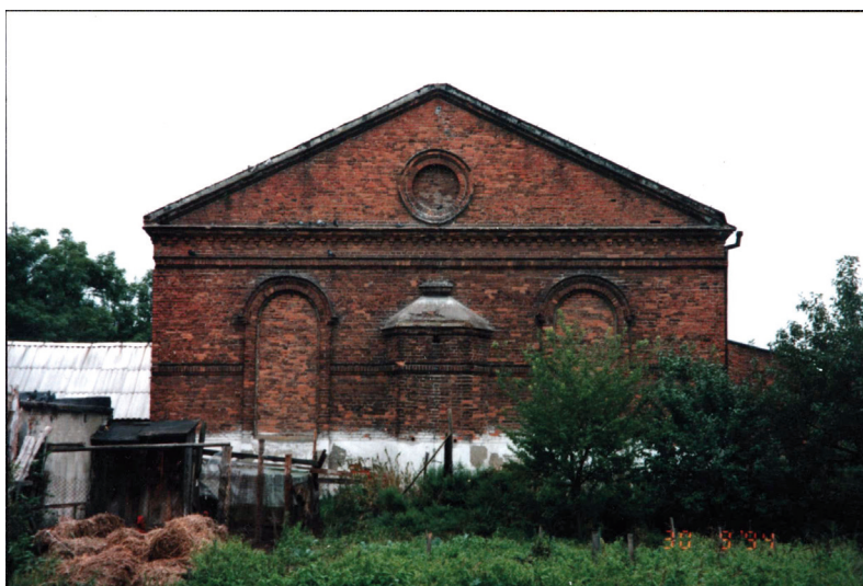
Fot. 14. Ściana wschodnia szadkowskiej synagogi z niewielką trójbocznie zamkniętą absydą, 1994 r. Absyda mieściła dawniej Aron ha-kodesz (drewnianą lub kamienną szafę ołtarzową do przechowywania zwojów Tory)