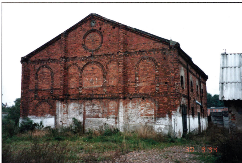
Fot. 13. Szadkowska bożnica – widok od strony zachodniej, 1994 r.