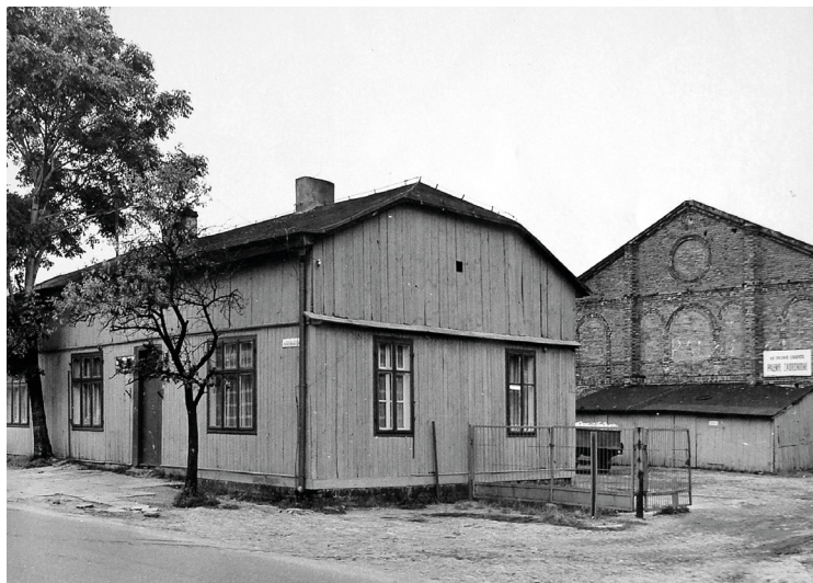
Fot. 10. Szadek, ul. Sieradzka 11, 1987 r., nieistniejący już drewniany budynek mieszkalny i wjazd na plac synagogi