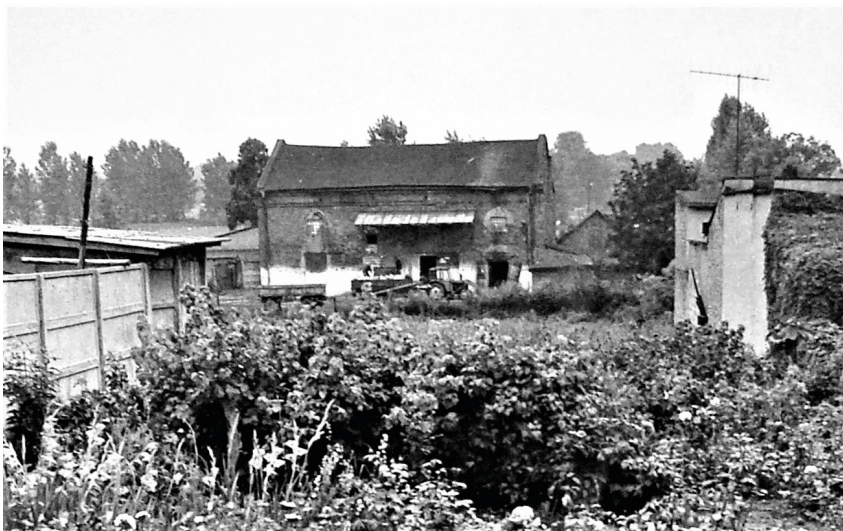
Fot. 16. Szadkowska synagoga i mykwa – widok ogólny od północy, 1987 r.