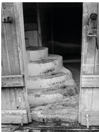
Fot. 15. Schody wewnętrzne synagogi w Szadku, 1987 r.