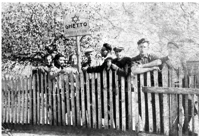
Fot. 9. Ludność pochodzenia żydowskiego przy prowizorycznym drewnianym płocie getta w Szadku