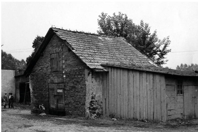
Fot. 17. Mykwa (łaźnia) przy szadkowskiej bożnicy, 1987 r.