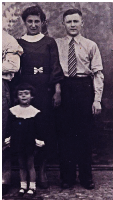
Fot. 5. Nieznani mieszkańcy Szadku pochodzenia żydowskiego