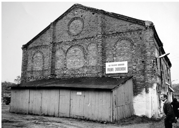
Fot. 11. Synagoga w Szadku przy ul. Sieradzkiej 11, 1987 r.