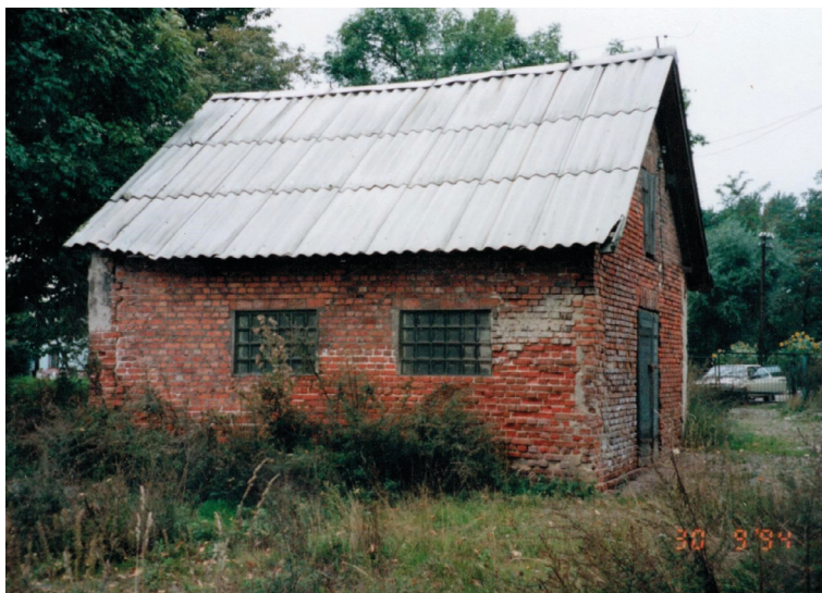
Fot. 19. Mykwa (łaźnia) przy szadkowskiej synagodze – widok od strony wschodniej, 1994 r.