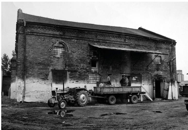
Fot. 12. Szadkowska bożnica użytkowana jako magazyn Gminnej Spółdzielni „Samopomoc Chłopska”, 1987 r.