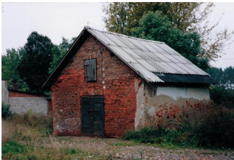
Fot. 18. Mykwa (łaźnia) przy szadkowskiej synagodze – widok od strony północno-zachodniej, 1994 r.