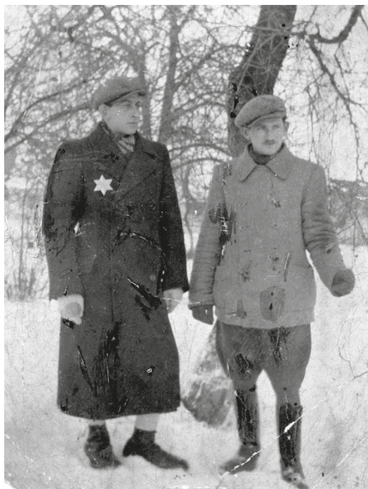
Fot. 8. Nieznani żydowscy mężczyźni w getcie szadzkowskim