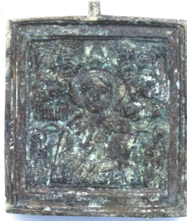
Fot. 3. Ikonka podróżna odkryta na zamku Pilcza w Smoleniu

przedstawienie Matki Boskiej najbardziej czczone w kościele prawosławnym. Na skrzydłach tryptyku umieszczone zostały wizerunki dwunastu świętych oraz archaniołów, w parach, po sześciu na każdym ze skrzydeł (fot. 1 i 2).