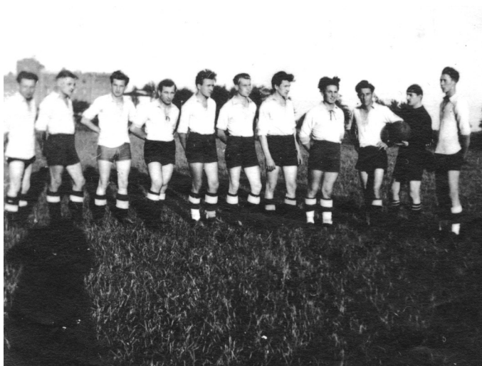
Fot. 1. Drużyna LZS w Szadku, ok. 1958 rok