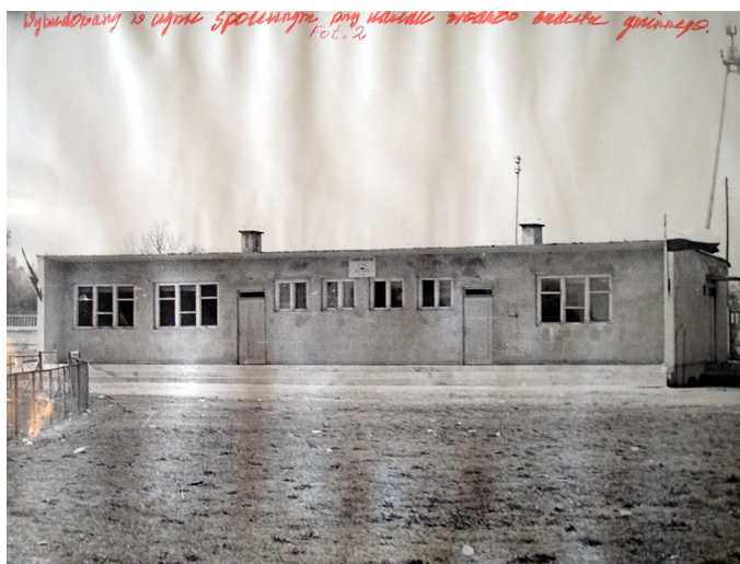
Fot. 15. Pawilon Ludowego Klubu Sportowego „Victoria” w Szadku przy ul. Sieradzkiej 18, wybudowany w formie społecznej, oddany do użytku w 1973 roku