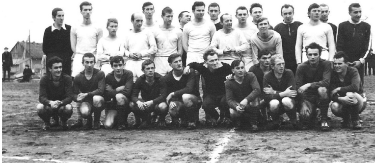
Fot. 13. Zawodnicy LZS Szadek i KS „Zjednoczeni” Pabianice, jubileusz 15–lecia działalności LZS Szadek, 7.11.1965