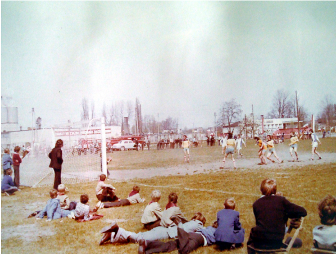
Fot. 22. Mecz z okazji 25-lecia LKS „Victoria” w Szadku, 1974 rok