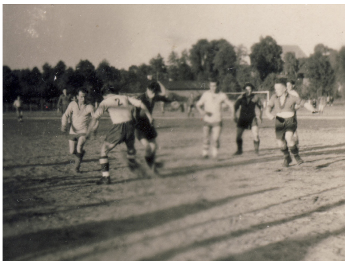
Fot. 3. Mecz LZS w Szadku, lata 50. XX w. (dziś teren Gminnej Spółdzielni „Samopomoc Chłopska” w Szadku)