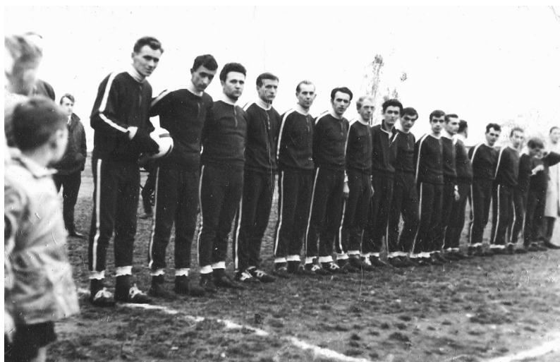
Fot. 12. Zawodnicy LZS Szadku, jubileusz 15–lecia działalności zespołu, 7.11.1965