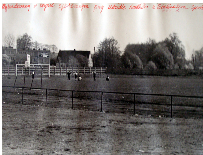
Fot. 16. Stadion sportowy Ludowego Klubu Sportowego „Victoria” w Szadku przy ul. Sieradzkiej 18, wybudowany w formie społecznej i przekazany do użytku w 1973 roku