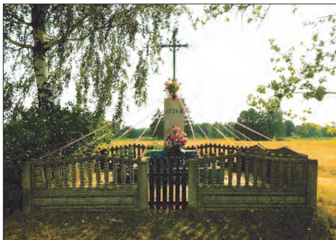
Fot. 6. Krzyż przy drodze w Boczkach

Kapliczka postawiona na skrzyżowaniu drogi wojewódzkiej Łódź – Sieradz (473) oraz drogi wiodącej przez wieś. Zbudowana z inicjatywy mieszkańców Boczek w 1947 r. dla upamiętnienia ofiar wojny. W 2003 r. uległa całkowitemu zniszczeniu przez samochody biorące udział w wypadku drogowym. Nowa kapliczka wybudowana z datków uczestników wypadku.