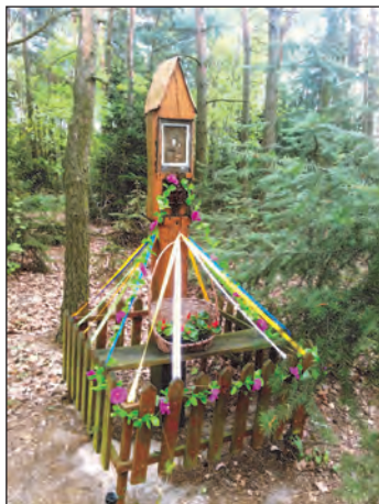
Fot. 8. Kapliczka na posesji państwa Jędrasiaków

Krzyż postawiony w 1960 r. w miejsce drewnianego krzyża, ustawionego najprawdopodobniej w pierwszych latach I wojny światowej, w miejscu pochówku poległych żołnierzy (zgodnie z tradycją poległych chowano na skrzyżowaniach dróg, w miejscach widocznych, dostępnych i wyraźnie oznaczonych) 39 .