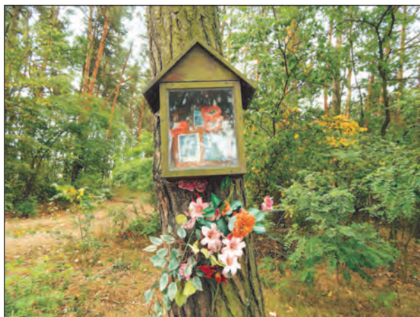
Fot. 10. Kapliczka przy drodze do Rossoszycy