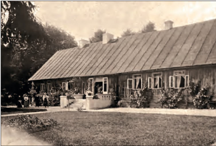
Fot. 2. Dwór w Boczkach, początek XX w.