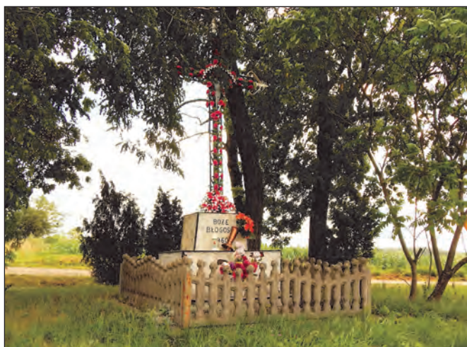
Fot. 7. Krzyż „na zakręcie” przed wjazdem do wsi

Krzyż powstał w 1934 r., najprawdopodobniej przy tworzeniu nowych podziałów geodezyjnych gruntów i miał wyznaczać granicę pomiędzy poszczególnymi częściami wsi.