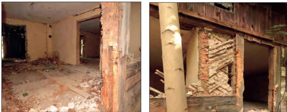
Fot. 3. Dwór w Boczkach – stan obecny