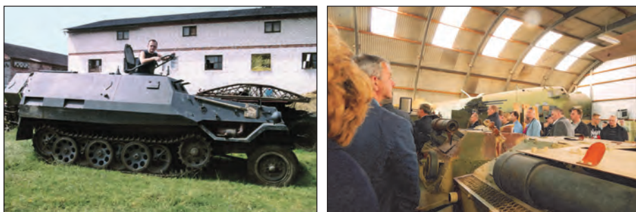
Fot. 12. Muzeum Historycznych Pojazdów i Techniki Motoryzacyjnej w Boczkach