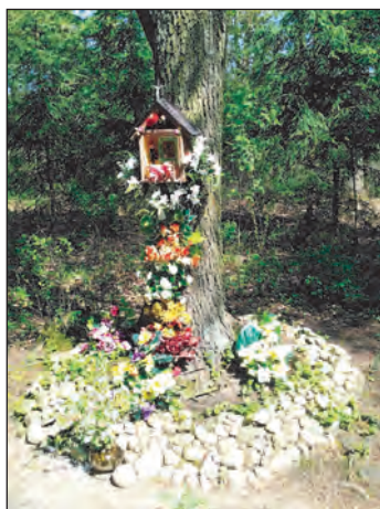
Fot. 11. Kapliczka przy drodze do Rożdżał