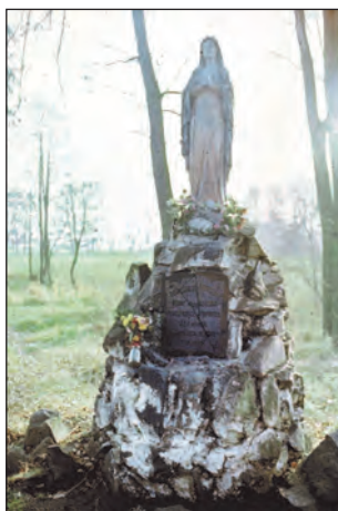
Fot. 4. Kapliczka Matki Boskiej Niepokalanej w parku podworskim w Boczkach

Kapliczka usytuowana na końcu alei grabowej i wpisana do rejestru zabytków. Powstała w 1926 r. z inicjatywy córki właściciela dworu. Figura Matki Boskiej (na policzku ślad po postrzale z okresu II wojny światowej) stoi na postumencie zbudowanym z kamieni polnych.