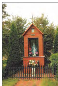
Fot. 5. Kapliczka Matki Boskiej w Boczkach (a) z 1947 r. i (b) z 2004 r.