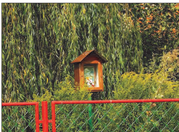
Fot. 9. Kapliczka na posesji nr 16 w Boczkach