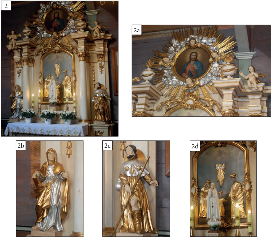
Fot. 2. Ołtarz kaplicy północnej w kościele św. Wawrzyńca w Rossoszycy 2a – obraz Serce Jezusa, 2b – rzeźba św. Anny, 2c – rzeźba św. Rocha, 2d – obraz Świętej Rodziny

Św. Anna, matka Maryi, ukazana jest w silnym kontraście 17 . Ręce ma uniesione, ugięte w łokciach. Prawa dłoń podtrzymuje wspartą na biodrze księgę, lewa dłoń pozostaje rozwartą. Głowa świętej okryta jest chustą i uniesiona lekko ku górze. Twarz kobiety jest pociągła, z głęboko osadzonymi oczami, z wydatnym nosem i pełnymi ustami. Postać ubrana jest w długą, sięgającą bosych stóp suknię, przewiązaną w pasie. Na ramionach ma płaszcz, podwiązany na wysokości bioder, lekko zebrany z prawej strony. Kanon proporcji figury jest przysadzisty, dłonie i stopy wykonane są bardzo realistycznie, sprawiają wrażenie zbyt dużych w stosunku do całej postaci. Widoczna jest pewna deformacja proporcji rzeźby, wynikająca z przeznaczenia jej do oglądania w skrócie perspektywicznym.