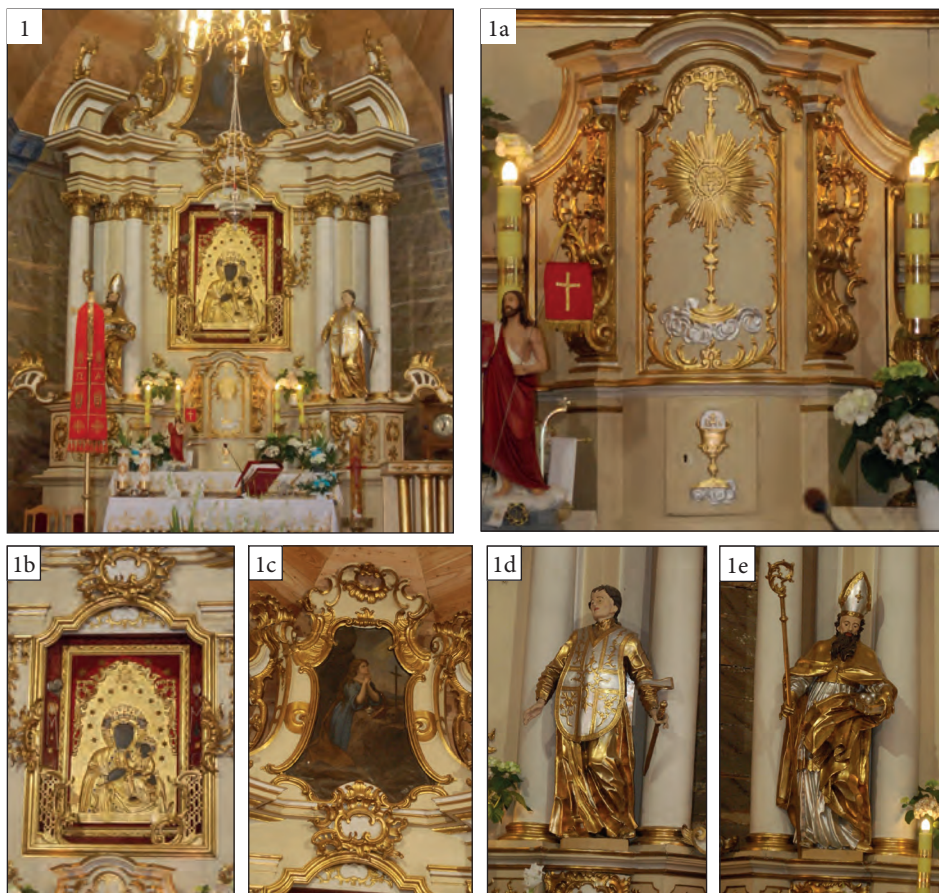
Fot. 1. Ołtarz główny kościoła św. Wawrzyńca w Rossoszycy

1a – tabernakulum, 1b – obraz Matki Bożej z Dzieciątkiem Jezus,