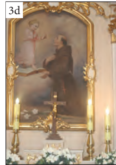
Fot. 3. Ołtarz kaplicy południowej w kościele św. Wawrzyńca w Rossoszycy:

3a – obraz Serce Maryi, 3b – rzeźba św. Apolonii, 3c – rzeźba św. Wojciecha, 3d – obraz św. Antoniego