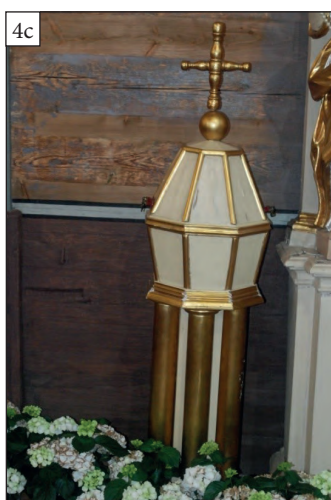
Fot. 4. Wyposażenie kościoła: 4a – prospekt organowy, 4b – ambona, 4c – chrzcielnica

Źródło: fot. J. Pośpieszyński [12.05.2017]