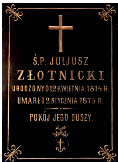
Fot. 4. Tablica epitafijna Juliusza Złotnickiego syna Stefana (1814–1875) w kościele parafialnym w Strońsku

Nowopowstałe miasto Zduńska Wola miało 14 ulic, rynek i plac jarmarczny, zwany potocznie targowiskiem końskim. Teren miasta graniczył od wschodu z wsiami szlacheckimi: Kawęczyn, Krabonów, Osmolin, Swędzieniejowice, od południa z wsiami: Paprotnia i Zduny, od zachodu z wsią rządową Czechy i Tymienicami, od północy z wsiami Stęszyce i Opiesin. Obszar miejski obejmował powierzchnię ok. 6,2 km 2 . Miasto należało do powiatu szadkowskiego, obwodu sieradzkiego, województwa kaliskiego.