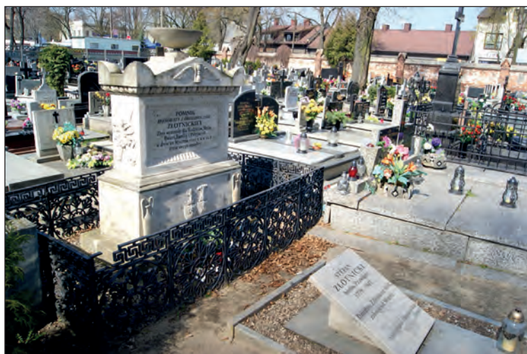
Fot. 7. Grób Honoraty i Stefana Złotnickich na starym cmentarzu w Zduńskiej Woli

Dziś mieszkańcom Zduńskiej Woli o postaci Stefana Józefa Wincentego Złotnickiego przypomina m.in. ulica nazwana jego imieniem, przy której ulokowane zostały najważniejsze urzędy w mieście 87 , tablica na budynku (dworku) Urzędu Miasta Zduńska Wola, medal pamiątkowy Towarzystwa Przyjaciół Zduńskiej Woli z sylwetką założyciela miasta z tombaku patynowanego o średnicy 7 cm, opracowany przez artystę-medaliera Edwarda Gorola i wybity w 1984 r. przez Mennicę Państwową w Warszawie 88 , noszące jego imię Publiczne Gimnazjum nr 4 przy ul. Kilińskiego, a także impreza plenerowa pt. „Miasteczko Złotnickiego”, organizowana od 2014 r. przez Towarzystwo Przyjaciół Zduńskiej Woli.