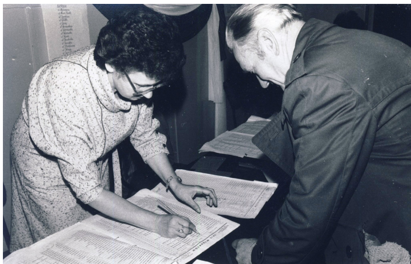
Fot. 10. Pobieranie kart do głosowania w Obwodowej Komisji Wyborczej w Szadku (wybory do Sejmu IX kadencji, 13 października 1985)