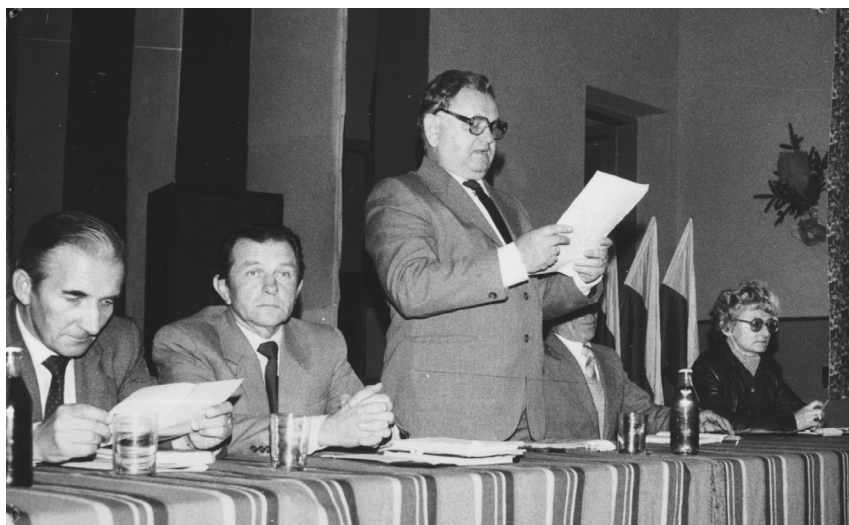
Fot. 2. Zorganizowane przez PRON spotkanie kandydata na posła Stanisława Zięby z wyborcami w budynku Ochotniczej Straży Pożarnej w Szadku, 1985 Przemawia Roman Malinowski – wicepremier PRL i prezes Naczelnego Komitetu ZSL, obok Stanisław Zięba