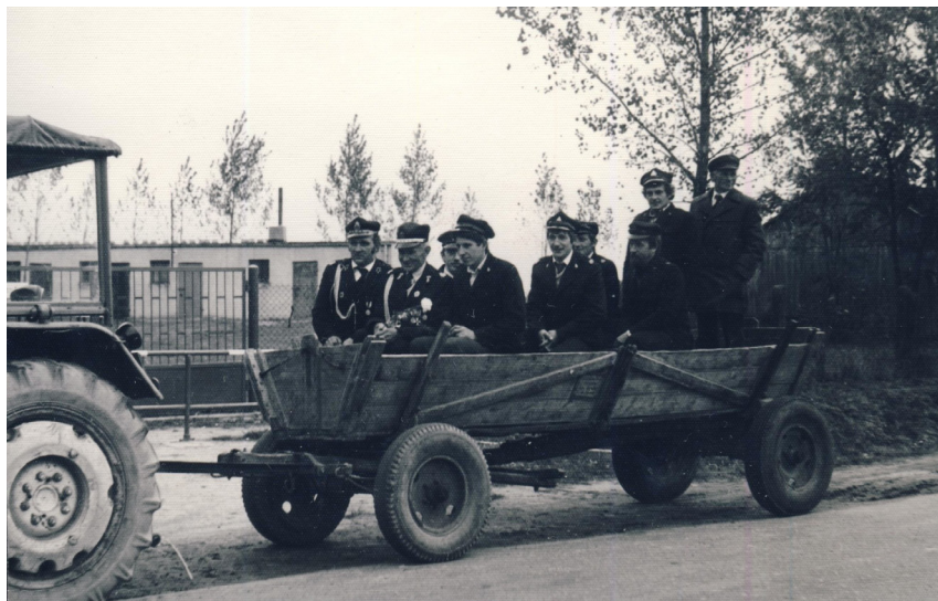
Fot. 19. Członkinie Ochotniczej Straży Pożarnej w drodze do lokalu wyborczego w Prusinowicach (wybory do Sejmu IX kadencji, 13 października 1985)