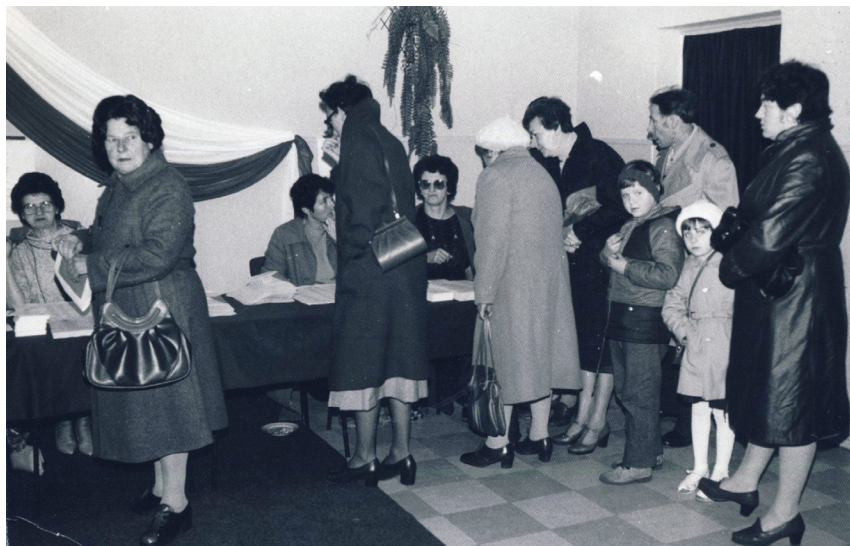
Fot. 15. Wyborcy w Obwodowej Komisji Wyborczej w Szadku (wybory do Sejmu IX kadencji, 13 października 1985)