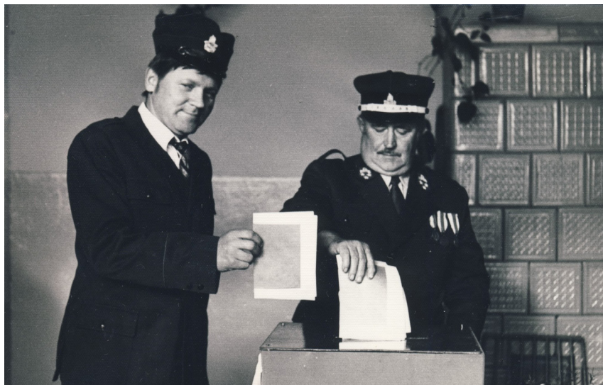
Fot. 21. Głosy w wyborach parlamentarnych oddają członkowie Ochotniczej Straży Pożarnej (wybory do Sejmu IX kadencji, 13 października 1985)