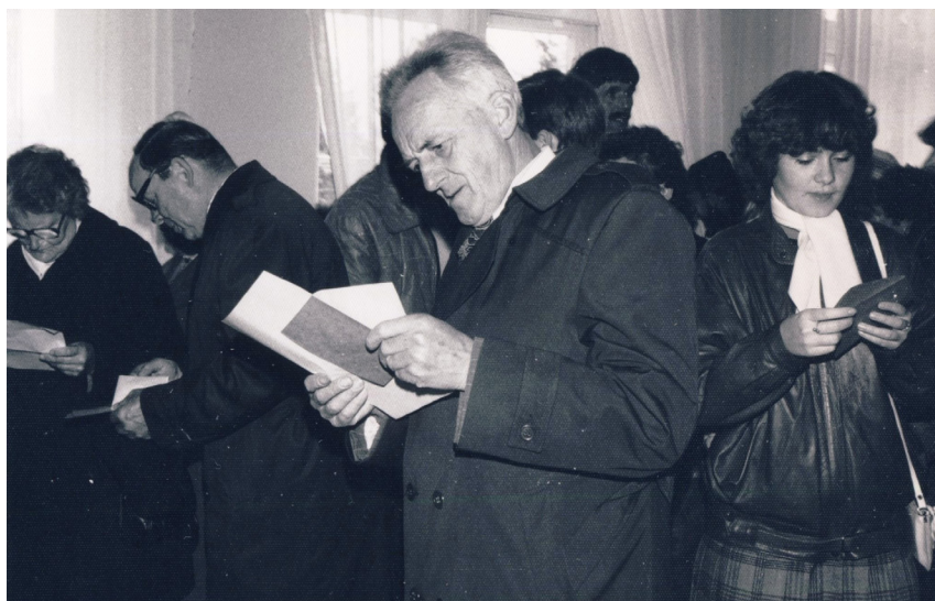
Fot. 22. Mieszkańcy Szadku po pobraniu kart do głosowania w lokalu wyborczym na terenie miasta (wybory do Sejmu IX kadencji, 13 października 1985)