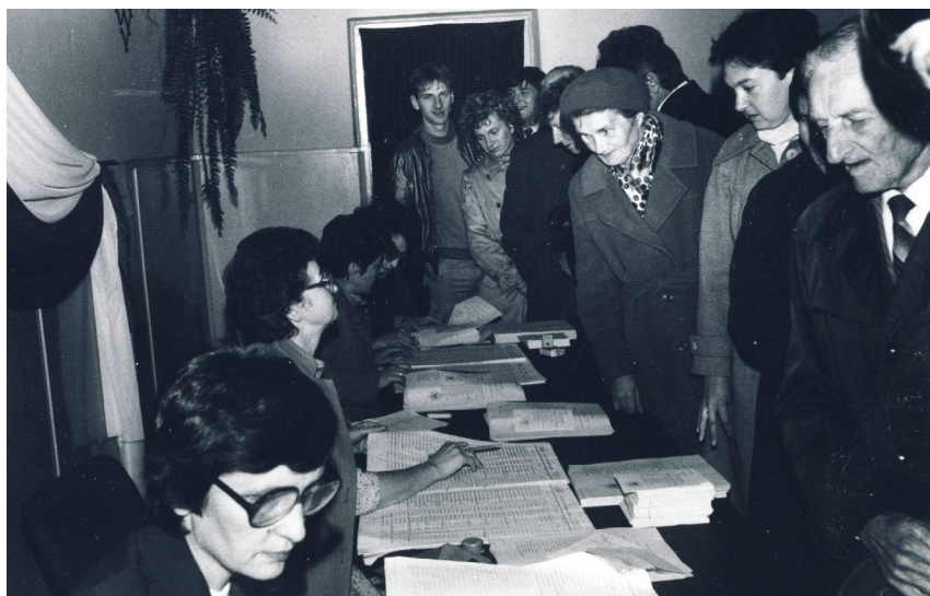
Fot. 8. Mieszkańcy Szadku w Obwodowej Komisji Wyborczej (wybory do Sejmu IX kadencji, 13 października 1985)