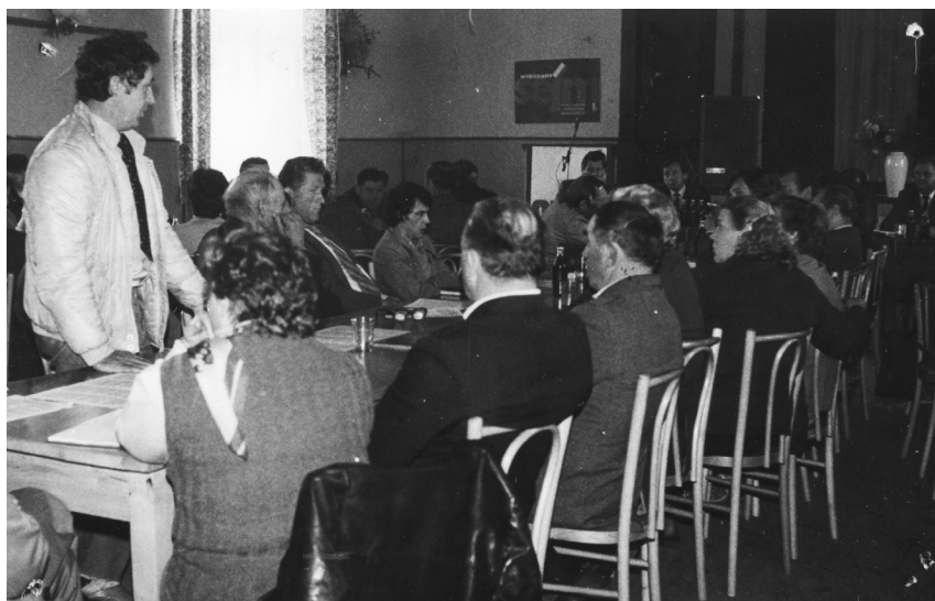
Fot. 4. Spotkanie przedwyborcze zorganizowane przez PRON z mieszkańcami Szadku w budynku Ochotniczej Straży Pożarnej w Szadku, 1985