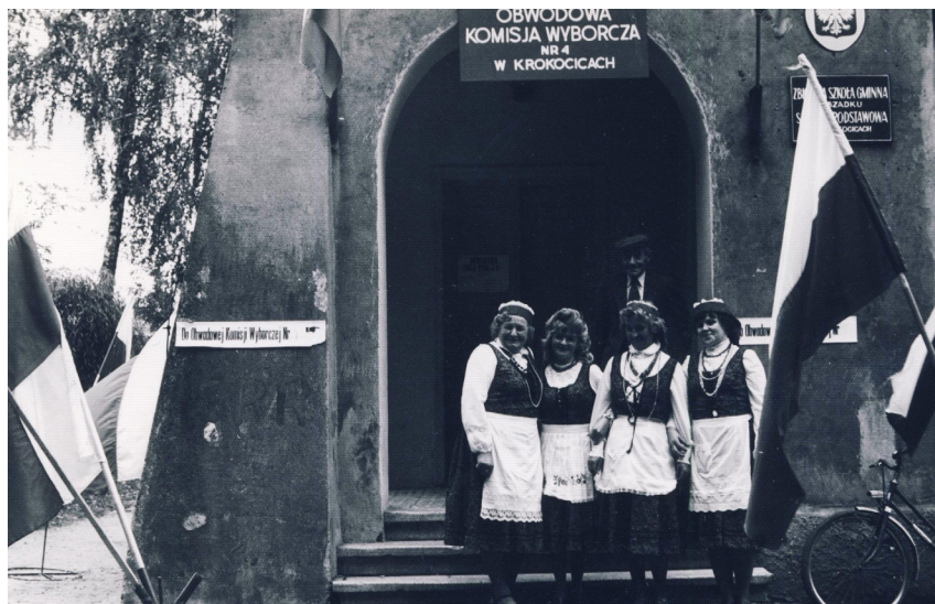
Fot. 17. Członkinie Koła Gospodyń Wiejskich z Krokocic przed lokalem miejscowej Okręgowej Komisji Wyborczej (wybory do Sejmu IX kadencji, 13 października 1985)