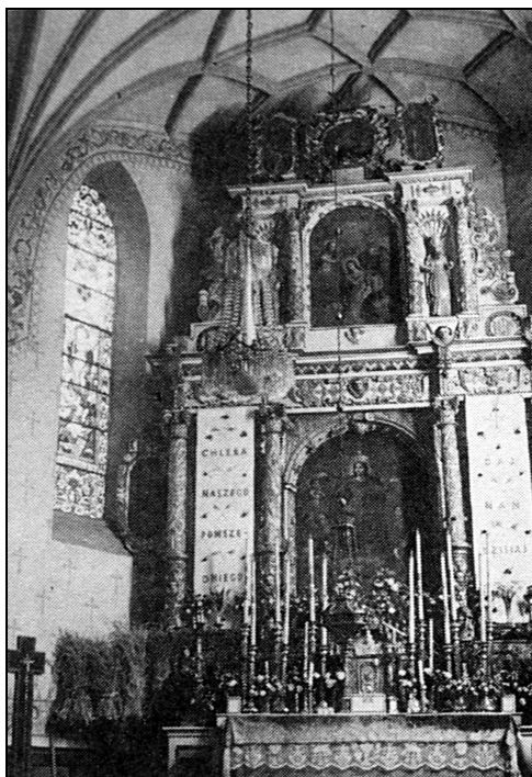
Fot. 2. Ołtarz główny w kościele parafialnym w Szadku

W tych dwóch szkołach objąłem po katechetce nauczanie religii. Dzieci nie były skore do nauki i posłuszeństwa. Prosiłem je więc, a także zachęcałem do lepszego postępowania, lecz niewiele to pomagało. Na pierwszy semestr 15 listopada w kilku klasach postawiłem negatywne stopnie z religii. Na sesji niektórzy nauczyciele wyrazili swoje zdziwienie: Dlaczego ksiądz w czasie „nagonki” na Kościół stawia dwóje? Odpowiedziałem im: Moi kochani, ujemne stopnie zmobilizują dzieci i rodziców do uczestniczenia w niedziele we Mszy św., prowadzenia zeszytów i uczenia się . Moje słowa sprawdziły się i od tego czasu wyniki były lepsze.