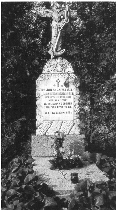
Fot. 4. Grób ks. Jana Stanisława Żaka na cmentarzu we Włocławku przy al. Chopina (kwatery 82)