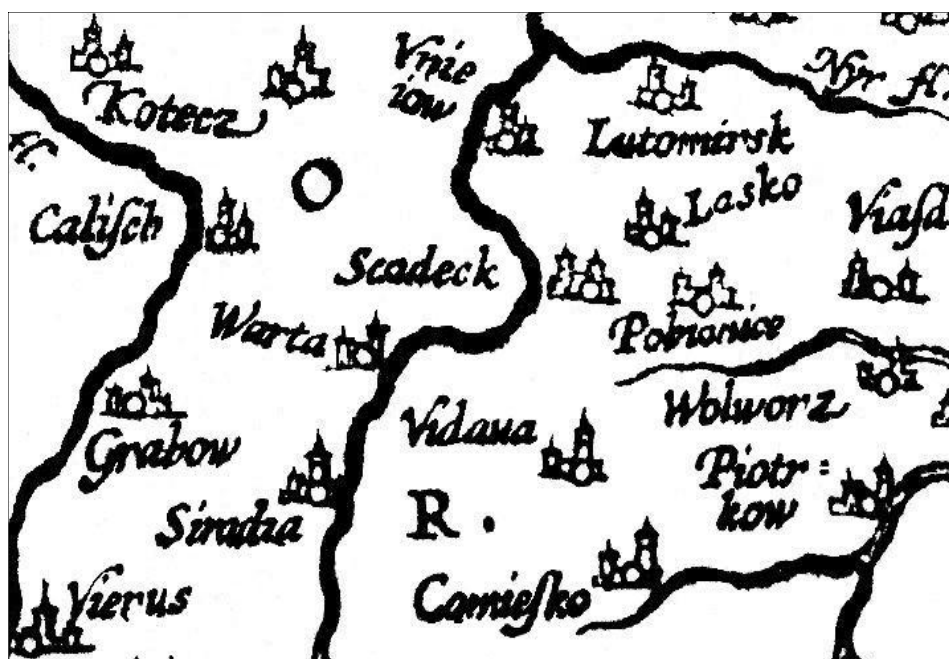
Ryc.1. Mapa okolic Szadku z okresu średniowiecza

Osadnictwo okresu wczesnośredniowiecznego (jak i późniejsze) potwierdzają znaleziska luźnych ułamków naczyń, znajduwane w Szadku i okolicach (ryc. 1–2). Ponadto godny uwagi jest zbiór renesansowych kafli piecowych z Zamłynia 17 .