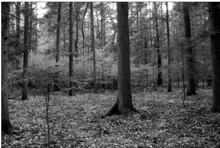
Fot. 1. Płat grądu z drzewostanem zdominowanym przez dąb szypułkowy i jodłę (oddz. 213g)