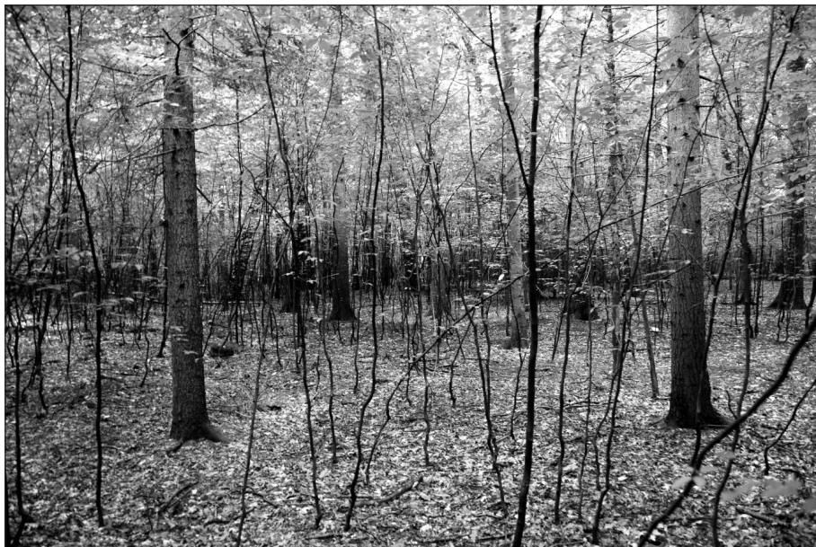
Fot. 3. Młode pokolenie grabu w południowej części rezerwatu (oddz. 213g)