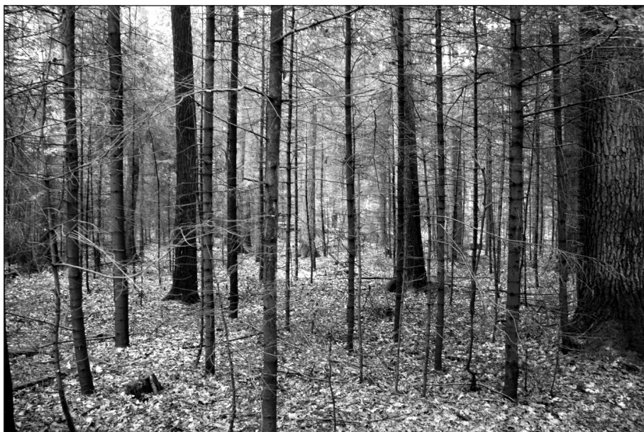
Fot. 4. Zwarty podszyt jodłowy świadczący o dużej dynamice odnawiania się tego gatunku (północno-zachodnia część oddz. 214d)