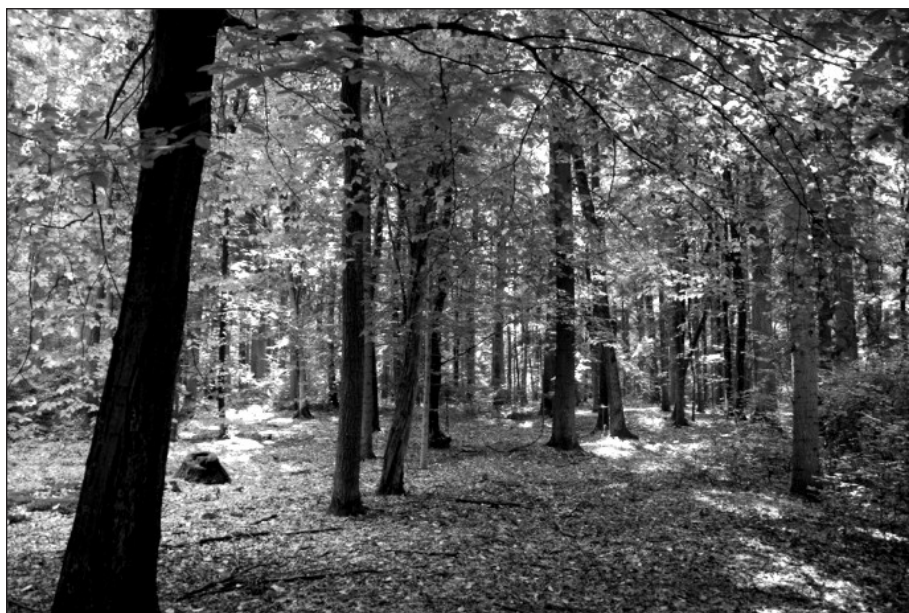
Fot. 2. Las grądowy wyróżniający się wysokim udziałem grabu zwyczajnego w niższej warstwie drzewostanu (centralna część oddz. 214d)