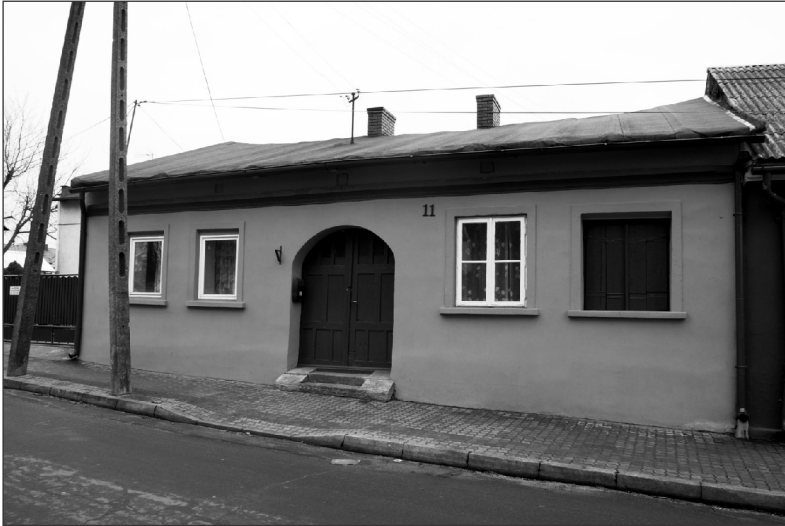
Fot. 2. Dom przy ul. Kościelnej 11 w Szadku, w którym urodził się Tadeusz Marian Kobusiewicz. Jest to drewniany budynek, z murowaną elewacją frontową i wschodnią połową budynku od podwórza, na rzucie prostokąta, kryty dachem dwuspadowym, o układzie kalenicowym

Źródło: fot. J. Stulczewski, 2012; E. Hryniak, Studium historyczno-konserwatorskie miasta Szadek , Kielce 1989