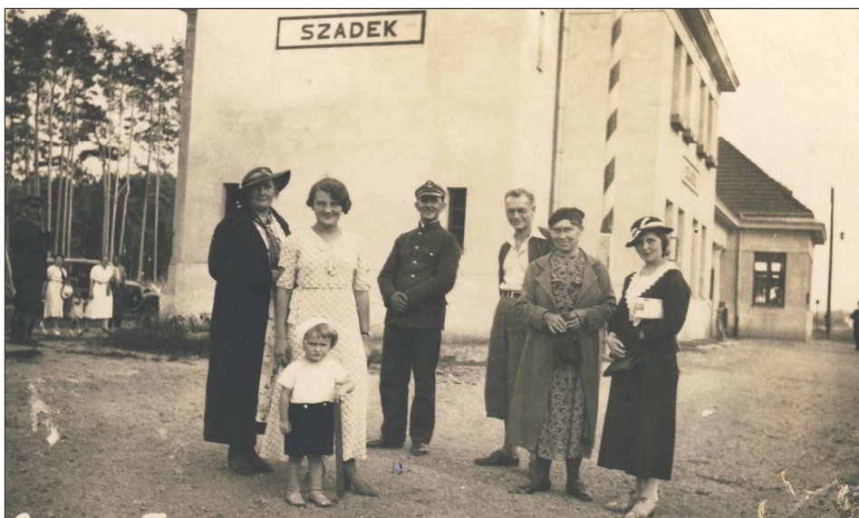
Fot. 7. Stacja kolejowa PKP w Szadku, 20 lipiec 1935 r.