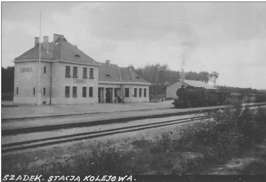
Fot. 6. Stacja kolejowa PKP w Szadku, 24 lipiec 1933 r.