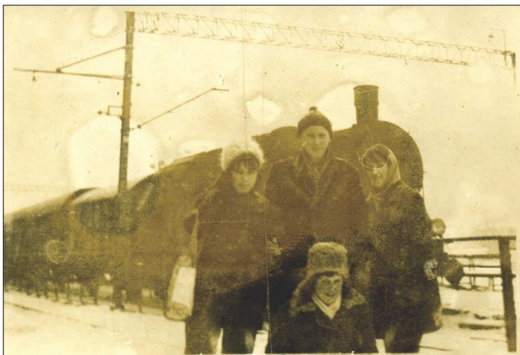
Fot. 11. Stacja kolejowa PKP w Szadku, lata powojenne