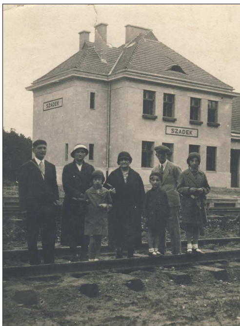
Fot. 10. Stacja kolejowa PKP w Szadku, lata 30. XX w.