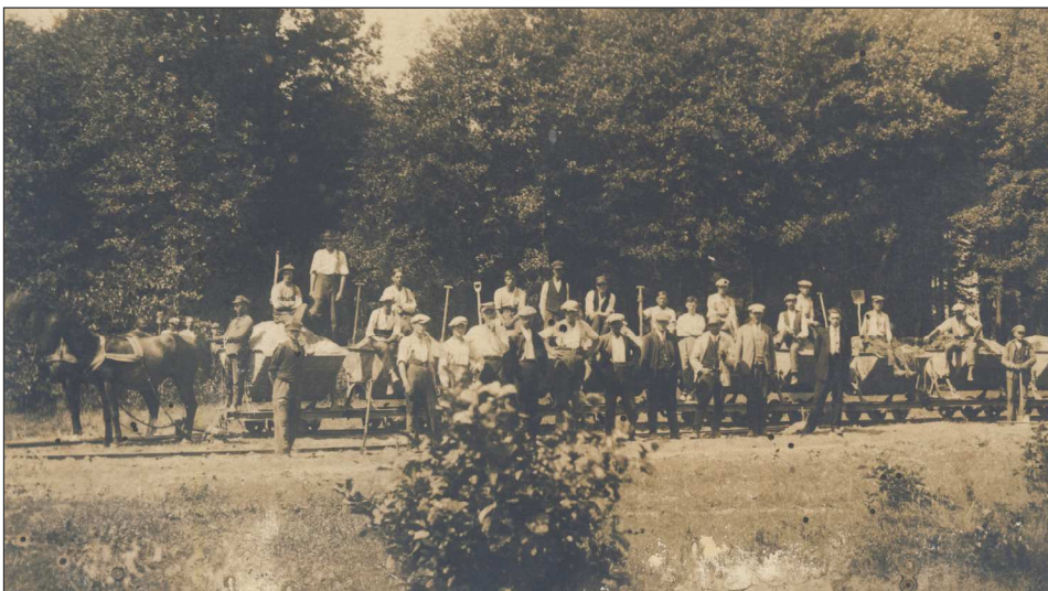
Fot. 1. Budowa linii kolejowej Herby Nowe–Gdynia na odcinku Karsznice–Szadek