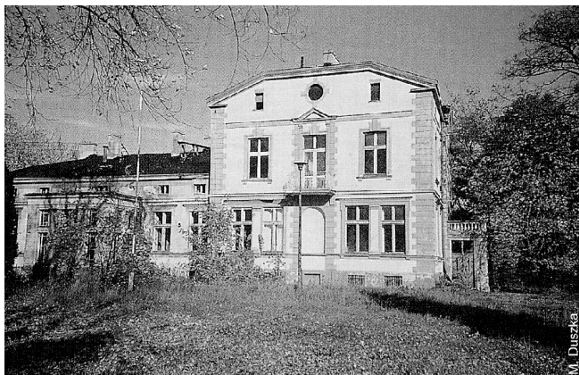
Fot. 4. Dwór w Piorunowie

W 1928 r. w Piorunowie M. Dąbrowska wraz ze swym przyjacielem spędziła święta Bożego Narodzenia: „ Na wsi było przyjemnie, cały czas swoją drogą pracowałam. Opracowałam tam czwartą redakcję siedmiu rozdziałów mojej powieści. Ale to już chyba będzie redakcją ostateczną ”.