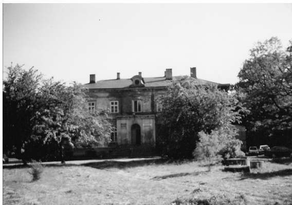
Fot. 8. Dworek w Zalesiu

Dworek w Zalesiu. W latach 1905–1907 we wsi Zalesie wzniesiono skromny, wiejski dworek. W roku 1957 doszło do jego przebudowy. Niestety żaden z potomków dziedzica nie zamieszkuje obecnie tego dworku.