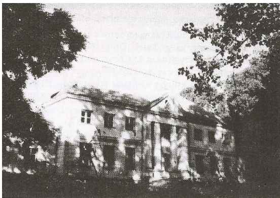
Fot. 5. Dworek w Prusinowicach