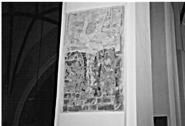
Fot. 3. Malowidło ścienne na filarze kościoła w Szadku