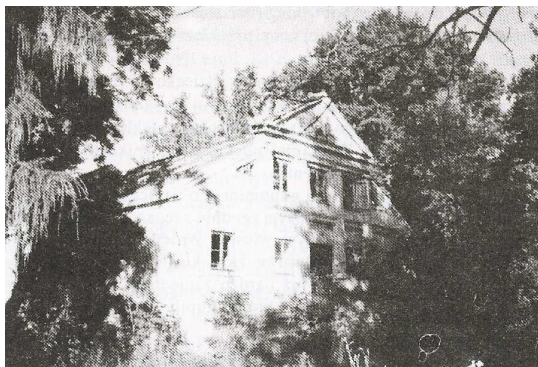
Fot. 6. Oficyna przy dworku w Prusinowicach