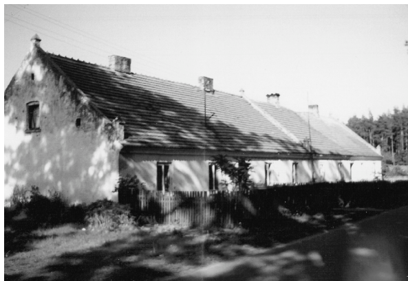
Fot. 9. Czworaki w Bąkach

enklawę zieleni o dużym znaczeniu w lokalnych układach ekologicznych.