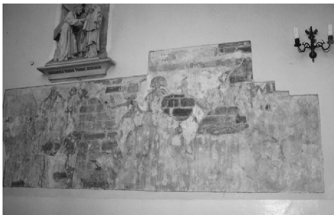
Fot. 2. Malowidło na ścianie płd. kościoła w Szadku

Z zainteresowaniem pisarka obejrzała późnogotycką dzwonicę z wąskimi otworami strzelniczymi.