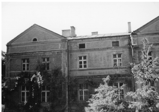
Fot. 7. Dworek w Zadzimiu

Dworek w Zadzimiu. Około 10 lat temu można było jeszcze podziwiać uroki parku, w centrum którego znajdowały się okazałe zabudowania zadzimskiego dworku.