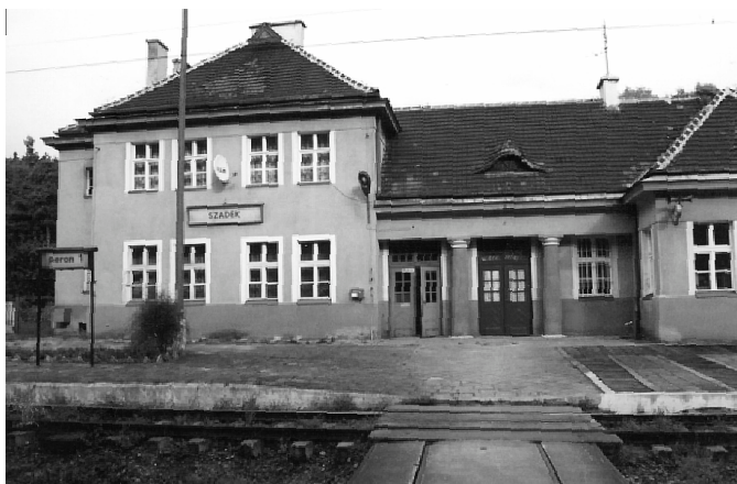
Fot. 1. Stacja kolejowa w Szadku