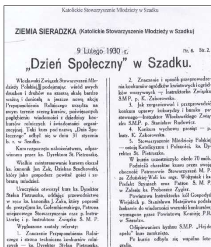
Fot. 6. Fragment tekstu pt. Dzień społeczny w Szadku Źródło: „Ziemia Sieradzka” 1930, nr 6, s. 2