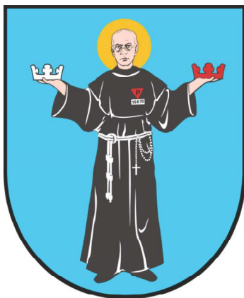
Ryc. 1. Herb powiatu zduńskowolskiego (herb uchwalony 24 listopada 2000 r.)

rozpostarte i lekko uniesione od ugięcia łokci. Na dłoniach św. Maksymiliana położone są dwie korony – biała na prawej i czerwona – na lewej dłoni. Postać świętego umieszczona została na błękitnym polu tarczy herbowej.