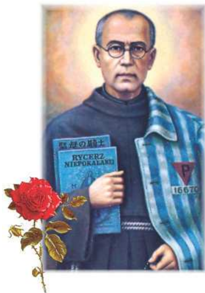
Ryc. 3. Maksymilian M. Kolbe w habitacie franciszkańskim i pasiaku obozowym