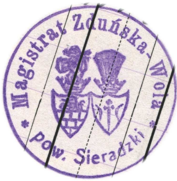
Ryc. 2. Pieczęć Magistratu Zduńskiej Woli (okres II Rzeczypospolitej)

herbu Ostoja 17 . Współczesny herb miejski opracowany został na wzór wyobrażenia z pieczęci magistrackich Zduńskiej Woli z okresu poprzedzającego odzyskanie II Niepodległości (1915–1918) 18 oraz z lat II Rzeczypospolitej (1918–1939) 19 (ryc. 2). Symbol międzywojennego samorządu Zduńskiej Woli występował także na pieczęciach urzędów i instytucji związanych z miastem. Na przykład z 1920 r. pochodzi odcisk pieczęci Urzędnika Stanu Cywilnego przy Magistracie Zduńskiej Woli 20 . Herb miasta (ukształtowany w okresie I wojny światowej) wykorzystywany był w Zduńskiej Woli także w pierwszych latach po zakończeniu II wojny światowej (np. w 1946 r.). Przypuszczam, że do 1947 r. w kancelarii miejskiej Zduńskiej Woli posługiwano się stemplami wykonanymi w okresie II Rzeczypospolitej, a nie nowymi tłokami przygotowanymi po styczniu 1945 r. Od 1947 r. dokumenty zduńskowolskie (np. Miejskiej Rady Narodowej w Zduńskiej Woli) pieczętowane były stemplami z wyobrażeniem niekoronowanego orła białego.