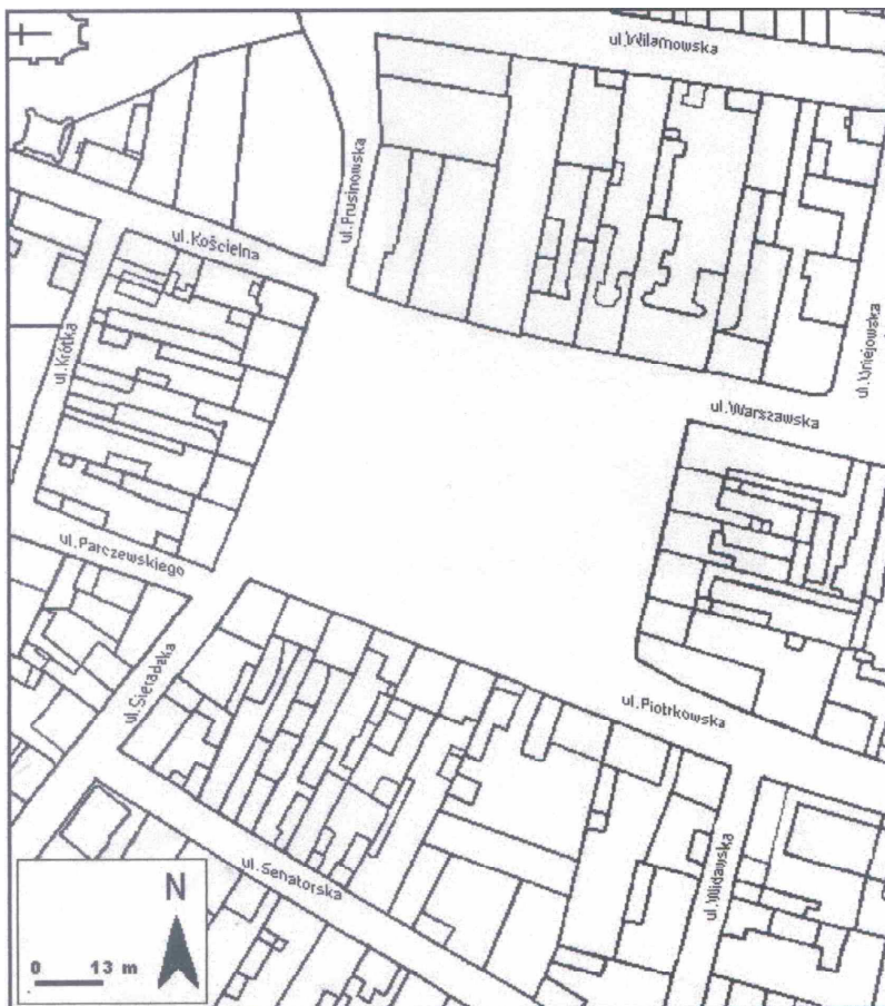
Rys. 2. Położenie rynku w przestrzeni miejskiej

prawdopodobne, że duże znaczenie przy planowaniu miasta miał fakt braku murów miejskich w Szadku, czego konsekwencją było dość duże „rozluźnienie” zabudowy oraz wymiary rynku. Biorąc pod uwagę układ przestrzenny miasta lokacyjnego, rynek stanowił rzeczywiste centrum, tak w sensie przestrzennym, jak i funkcjonalnym, koncentrując handel, komunikację oraz władzę. Wytyczony rynek przyjął początkowo wymiary 125 x 75 m (w przeliczeniu na powierzchnię 0,9 ha).