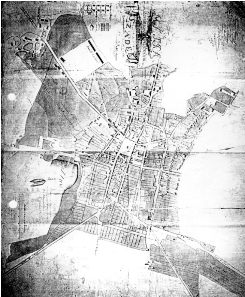
Rys. 1. Szadek, plan miasta z 1824 r.

samym charakterystyczne cechy danemu ośrodkowi i często wpływały na ich oblicze (małe miasta rolnicze).