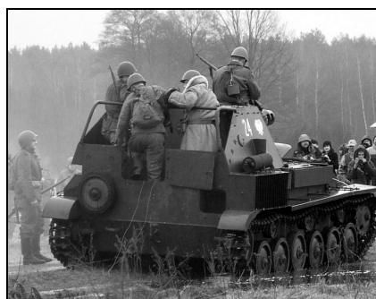
Fot. 1–4. Sceny z widowiska plenerowego Wojenne wspomnienie