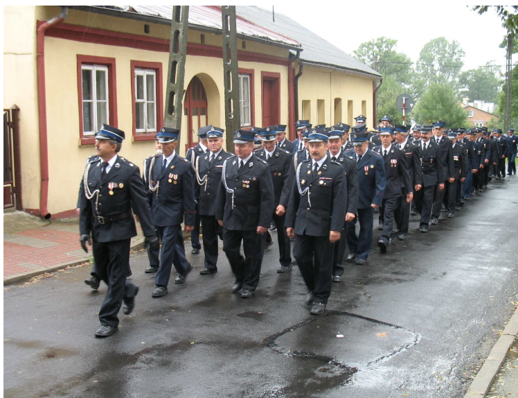
Fot. 4. Przemarsz druhów OSP podczas obchodów 110 jubileuszu jednostki

W bieżącym roku, 9 września drzewie świętowali 110-lecie istnienia jednostki. Uroczystości oficjalnie zainaugurowała msza św. w szadkowskiej kolegiacie, po której strażacy, w tym reprezentanci okolicznych jednostek, oraz orkiestra przemarszerowali ulicami miasta pod remizę (fot. 4).