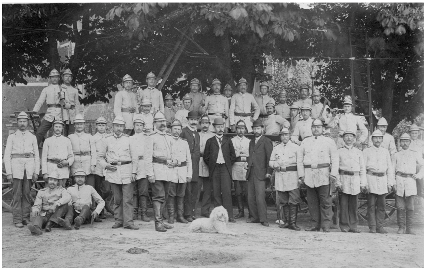
Fot. 1. Drużyna Ochotniczej Straży Pożarnej w Szadku (ok. 1912 r.)

miejsowości skorzystały na powołaniu jednostki gaśniczej, której członkowie niejednokrotnie brali udział w walkach z pożarami wybuchającymi na ich terenie.