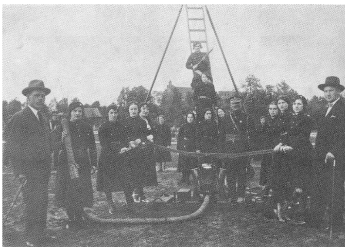
Fot. 3. Drużyna szadkowskich samarytanek podczas ćwiczeń ze sprzętem gaśniczym (ok. 1932 r.)

Interesującym epizodem z dziejów szadkowskiej straży pożarnej było funkcjonowanie w latach 1932–1939 drużyny samarytanek (fot. 3). W jej skład wchodziły kobiety przeciwzione w obsłudze sprzętu przeciwpożarowego, jednakże ich główna rola polegała na udzielaniu pomocy sanitarnej poszkodowanym w wyniku klęsk żywiołowych oraz ofiarom działań wojennych. Jedną z wielu zasług drużyny żeńskiej było propagowanie kultury. Samarytanki ożywiały życie lokalnej społeczności kontynuując tradycję wystawiania przedstawień teatru amatorskiego.