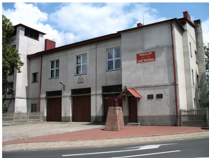
Fot. 5. Współczesna strażnica OSP w Szadku

widowiskowej (na miejscu starych, zniszczonych desek pojawił się bukowy parkiet), a także urządzeniem pomieszczenia socjalnego na miejscu dawnej hydroforni. Koszty wspomnianych przedsięwzięć poniosła gmina Szadek oraz sami strażacy. Na bieżący rok przewidziane jest dodatkowo pokrycie zewnętrznych elewacji remizy nową powłoką farby.