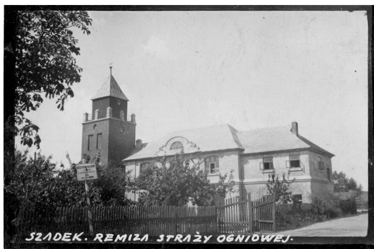
Fot. 2. Międzywojenna strażnica OSP w Szadku (ok. 1935 r.)

Budowa siedziby straży ogniowej – dwukondygnacyjnego obiektu o interesującej formie architektonicznej (fot. 2), została ukończona w 1923 r.