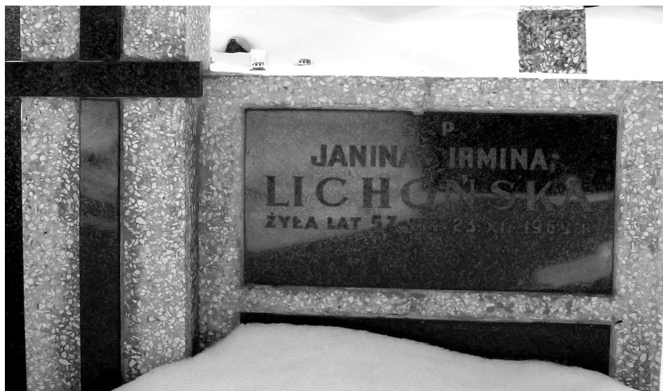
Fot. 5. Grób Irminy Lichońskiej na cmentarzu katolickim na Woli w Warszawie (kwatery 38, szereg 4, grób nr 7). Stan z lutego 2010 r.

Źródło: Mysł filozoficzno religijna reformacji XVI wiek , Warszawa 1972, s. 8