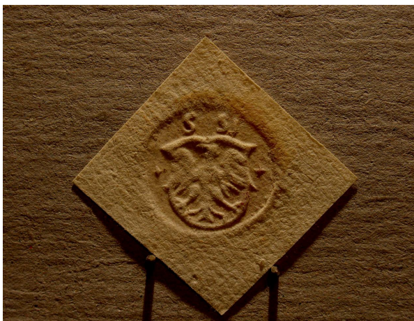
Fot. 2. Pieczęć z Orłem Białym niekoronowanym w renesansowej tarczy herbowej, wykorzystywana w Szadku od poł. XVI do poł. XVII w.

dokumentacją, wytwarzaną podczas posiedzeń sądów w Piotrkowie Trybunalskim 6 , Sieradzu 7 i Szadku 8 . Pieczęć z Orłem Białym niekoronowanym w renesansowej tarczy herbowej (fot. 2.) wykorzystywano w Szadku przynajmniej od 1553 9 aż do 1659 r. 10 Nie wiemy, jak długo pieczęć szesnastowieczna pozostawała w „służbie kancelaryjnej” sieradzkich sądów ziemskich, w tym również tych odbywanych w Szadku. Nie znamy też pieczęci, która mogła ją zastąpić. Pomiędzy ostatnim, znanym użyciem pieczęci szesnastowiecznej a pojawieniem się kolejnej pieczęci pozostaje luka blisko stu lat, nieoświetlona, jak dotąd, żadnym przekazem sfragistycznym.