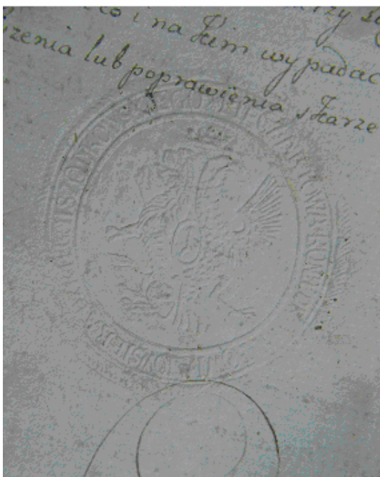
Fot. 3. Pieczęć z 1792 r. znajdująca się pod odpisem z Ksiąg Konfederacji Wojewódzkiej Powiatów Sieradzkiego i Szadzkowskiego

Kłęska wojsk polskich w wojnie z Rosją w 1792 r. przesądziła o losie Konstytucji 3 Maja, także i innych ustaw, reformujących państwo, zdecydowała o kształcie terytorialnym Polski. Szlachta sieradzka w sierpniu i wrześniu 1792 r. zgłosiła swe przystąpienie do targowicy. Najprawdopodobniej z tego okresu pochodzi aktowa pieczęć konfederacji 26 , akcentująca w treści legendy otokowej związek z powiatami sieradzkim i szadzkowskim (fot. 3.). Pole pieczęci wypełniło ponownie godło herbu województwa sieradzkiego. W warstwie symbolicznej dopełnione zostało ono szlacheckim herbem Ogończyk, umieszczonym na piersiach lwa i orła sieradzkiego. Jej odciski znane są m. in. z ekstraktów z Ksiąg Konfederacji Wojewódzkiej Powiatów Sieradzkiego i Szadzkowskiego, opisujących czynności sądowe z listopada 1792 i 1793 r. 27