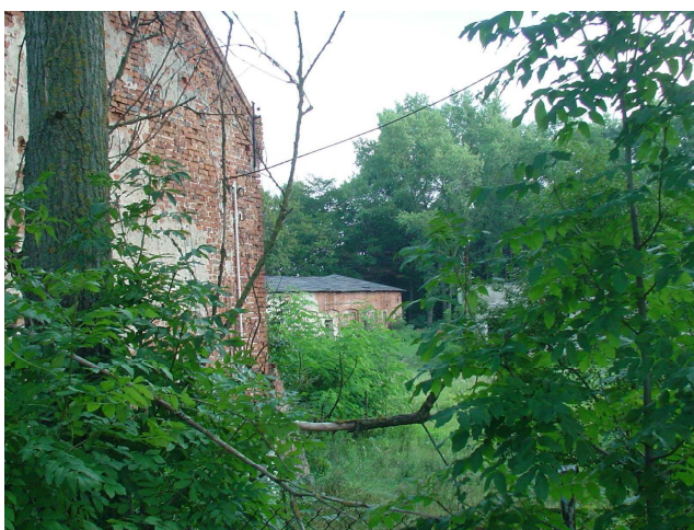
Fot. 3. Fragment spichlerza i chlewni folwarku w Boczkach 2007 r.