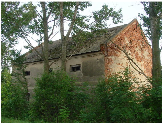
Fot. 2. Spichlerz folwarku w Boczkach 2007 r.