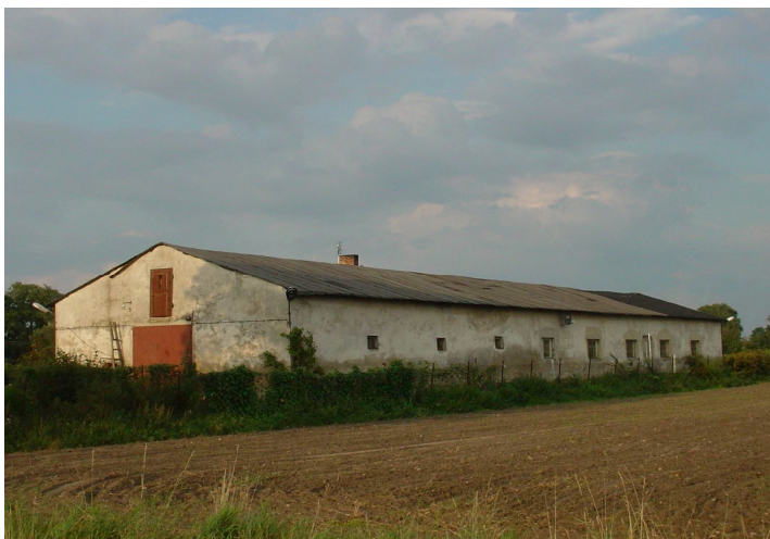
Fot. 1. Folwark w Kotlinach 2007 r.