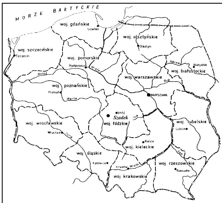
Rys. 3 Miejsce Szadku w podziale administracyjnym z lat 1946-50

W cztery lata po powstaniu styczniowym (1863 r.) doszło do kolejnych zmian administracyjnych tych ziem. Szadek znalazł się w odtworzonej guberni kaliskiej, będąc jednym z kilku miast powiatu sieradzkiego. Wówczas powstała nowa jednostka administracyjna najniższego szczebla (gmina), miasto stało się siedzibą gminy o tej samej nazwie oraz podobnie, jak większość małych miast utracił swe prawa miejskie w 1870 r.