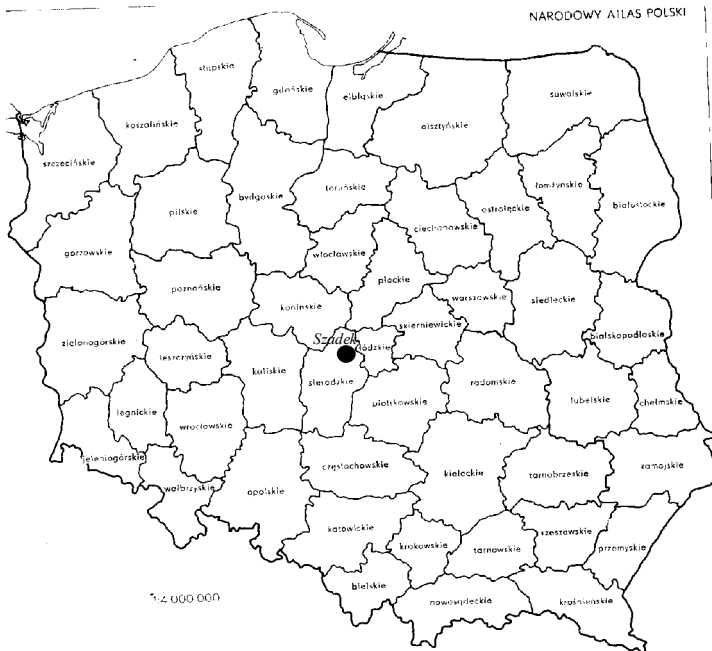
Rys. 4 Szadek po podziale administracyjnym Polski w 1975 r.

Gmina Szadek znalazła się ponownie w powiecie sieradzkim. Była ona położona przy wschodniej granicy powiatu, na krawędzi z powiatem łaskim. Pod względem podziałów specjalnych Szadek związany był z Sieradzem i w większości wypadków z Łodzią, będącą siedzibą władz wyższego szczebla administracji specjalnej. Szadek m.in. znalazł w Łódzkim Okręgu Wojskowym, podlegając pod Łódzką Izbę Skarbową, jednak pod względem podziału sądowego należał do Kaliskiego Okręgu Sądowego i Warszawskiego Okręgu Apelacyjnego. W tym okresie również zabrakło czynnika (np. przemysłu lub dogodnego połączenia komunikacyjnego) umożliwiającego rozwój miasta i napływ ludności, także w tym czasie ominęła go ważna droga Łódź-Pabianice-Łask-Sieradz.