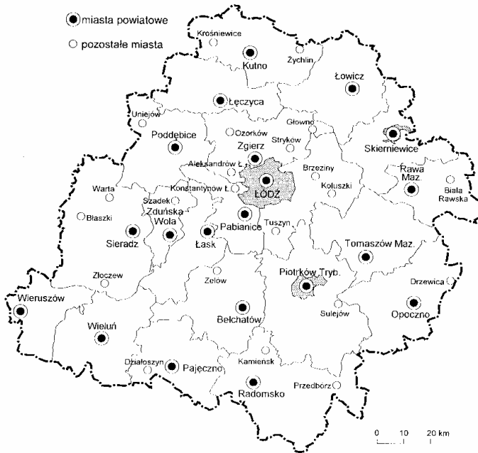
Rys. 5 Szadek w nowym województwie łódzkim