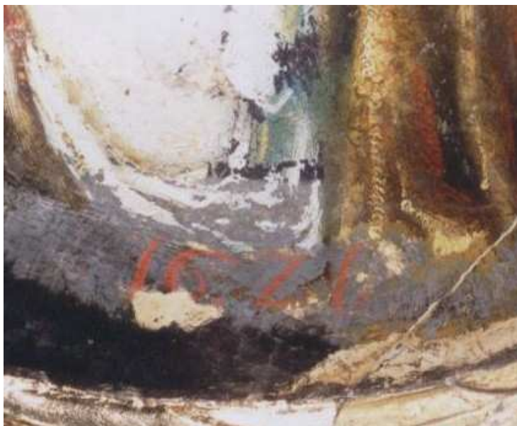
Fot. 5. Czerwonym kolorem napisana data „1621” w dolnej części obrazu św. Magdaleny

Piętro niżej, na wysokość nastawy znajdował się obraz „Koronacji Matki Boskiej”, dwie rzeźby św. Mikołaja i bliżej nieokreślonego biskupa oraz para przepięknych mszaków z ornamentem okuciowym i grupą czterech pękających owoców granatu. Niestety tutaj czekało nas rozczarowanie. Wykonane odkrywki sondażowe wykazały, że pod warstwą zaprawy znajduje się tylko drewno ołtarzowe. Nie ma żadnej pośredniej warstwy zaprawy i warstwy malarskiej, która zdradziłaby nam wcześniejszy wygląd ołtarza. Jedynie różowawe kreski na drewnie, pozostawione kiedyś przez rzemieślników, łączą ten zabytek z dawnymi wykonawcami, ale z którymi i z jakiego wieku – niewiadomo.