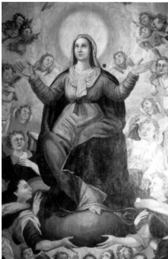
Fot. 1. Obraz „Wniebowzięcia Matki Boskiej” po zakończeniu prac konserwatorskich

Otaczała ją dziewięć aniołów. Cztery główki ze skrzydełkami w górnej części obrazu po obu stronach rozłożonych rąk Matki Boskiej. Nieco bliżej „ziemi” gołe torsy dwóch aniołów wyłaniających się z chmur rękoma złożonymi do modlitwy. Najciekawszym wydarzeniem było odkrycie siódmego anioła w miejscu, w którym nikt nie spodziewał się go znaleźć, a mianowicie pośrodku grupy muzykujących aniołów w dolnej części obrazu. Przykrywała go bowiem nieudolnie namalowana chmura. Anioł miał przed sobą rozłożoną księgę. Może to partytura jakiegoś utworu muzycznego, a sam anioł albo dyryguje grupie, albo też śpiewa pieśń ku czci Matki Bożej (fot. 2)