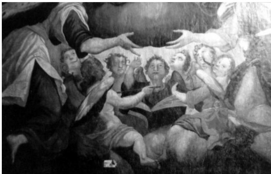
Fot. 2. „Koncert Aniołów” w dolnej partii ołtarzu

Zmieniła się też kolorystyka obrazu. Pojawiło się wiele lekkich kolorów, półtonów i mniej nasyconych barw, czyniąc obraz o wiele bogatszym w odbiorze i bardziej wysmakowanym.