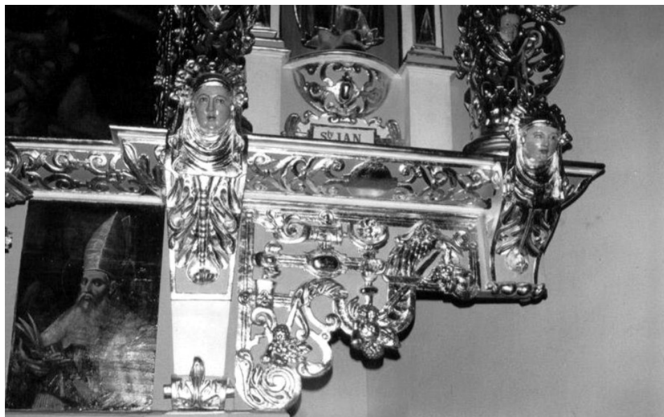
Fot. 3. Bogactwo snycerki dolnej partii ołtarza