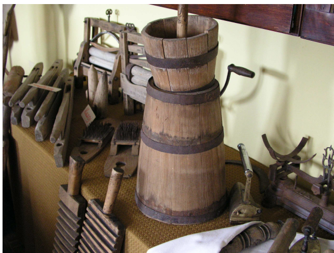
Fot. 5. Muzeum szkolne w Szadku – fragment ekspozycji poświęconej chłopskiej zagrodzie

Sprzęt domowy reprezentują: łopata do wyjmowania chleba, koszyczki i formy słomiane, w których dojrzewało ciasto chlebowe, kwećki drewniane do przegniatania ziemniaków i praska do sera (fot. 5).