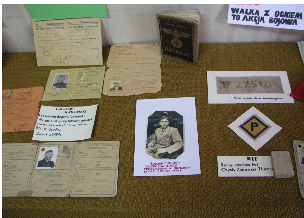
Fot. 11. Dokumenty z lat okupacji

W zbiorach muzeum szadkowskiego znajduje się również szereg innych dokumentów z lat wojny (fot. 11), wiele z nich ilustruje obowiązek przymusowej pracy na rzecz III Rzeszy ( Arbeitsbuch, Arbeitkart ).