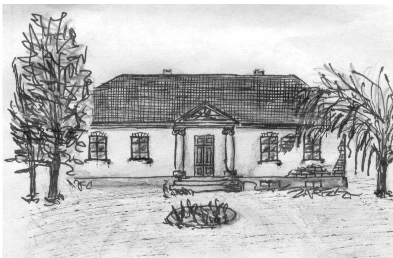
Rys. 2. Dwór w Dziadkowicach (widok części frontowej)

murowane z cegły na zaprawie wapiennej, otynkowane, podpiwniczone, oparte na rzucie prostokąta. Podstawową fizjonomiczną różnicą między dworami ziemi szadkowskiej jest ich wielkość i to ona prowadzi w konsekwencji do dalszego zaostrażania kontrastu między nimi. Dwory w Prusinowicach i Rzepiszewie są duże, piętrowe, natomiast w Dziadkowicach jest niewielki, parterowy (rys. 2).