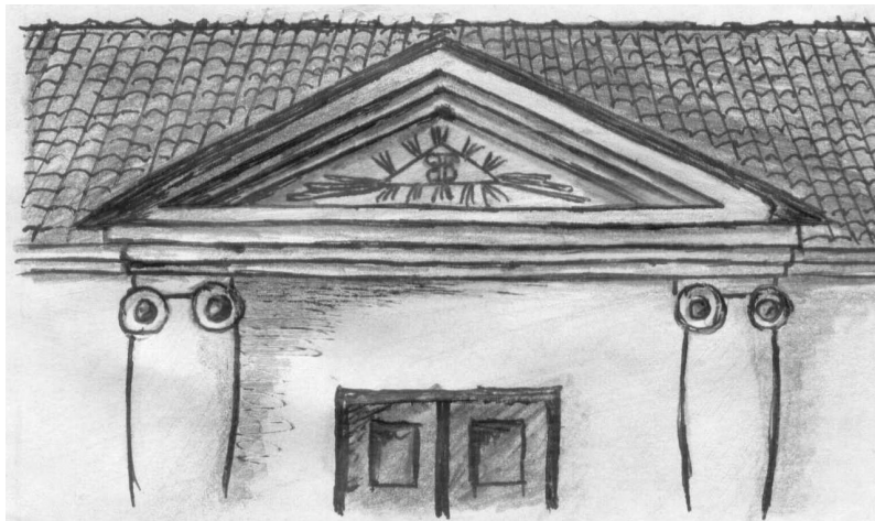
Rys. 4. Trójkątny fronton wejścia głównego

umieszczając właśnie taki symbol, wyraził prośbę do Boga o opiekę i zesłanie harmonijnego ładu na swoje ognisko domowe.