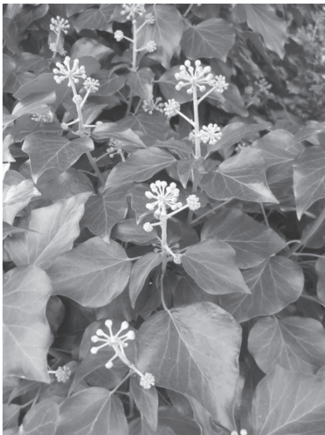
Fot. 1. Kwitnący bluszcz pospolity Hedera helix

Hedera helix jest rośliną płożącą się lub wspinającą się, dorastającą nawet do 30 m wysokości. Wspinające się okazy (w pierśnicy, na wysokości 1,3 m od poziomu gruntu) osiągają średnicę do 25 cm. Pędy pokrywają korzenie przybyszowe, które ułatwiają przyczepianie się wspinających się osobników do podpór. Pędy kwitnące nie posiadają korzeni przybyszowych, rosną wzniesione, odstając od podpór. Liście są zimozielone, ustawione skrętolegle. Bluszcz charakteryzuje się heterofilią, czyli różnolistnością. Pędy kwitnące pokrywają liście jajowate lub romboidalne, całobrzegie, błyszczące. Pędy płonne posiadają liście 3–5 klapowe u nasady sercowate. Kwiaty są obupłciowe zebrane w baldachokształtne kwiatostany 3 . W Polsce bluszcz kwitnie we wrześniu–październiku. Owocem są pestkowce początk-