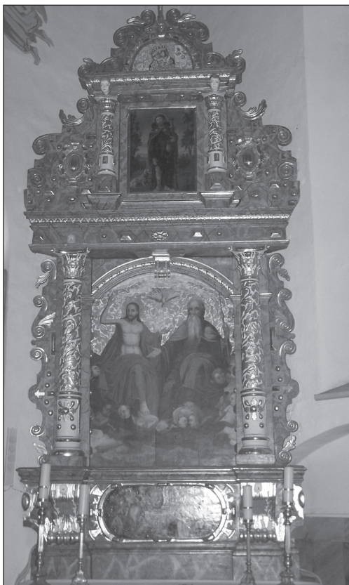
Fot. 4. Kościół parafialny p.w. św. Mikołaja i św. Doroty w Kwiatkowicach, ołtarz boczny południowy – Świętej Trójcy Źródło: zdjęcie K. Jarno-Cichosz, 2015

ciątkiem, a na wieńczącym ołtarz gzymsie umieszczono pełnoplastyczną rzeźbę św. Kazimierza. W pochodzących z XVIII i XIX w. opisach wyposażenia kościoła nie wspomniano jednak o wieńczącej ołtarz figurze, podczas gdy wśród umieszczonych w ołtarzu obrazów, obok przedstawień Madonny z Dzieciątkiem, patrona parafii św. Mikołaja i św. Józefa, wymieniany był jeszcze wizerunek św. Rocha 17 .