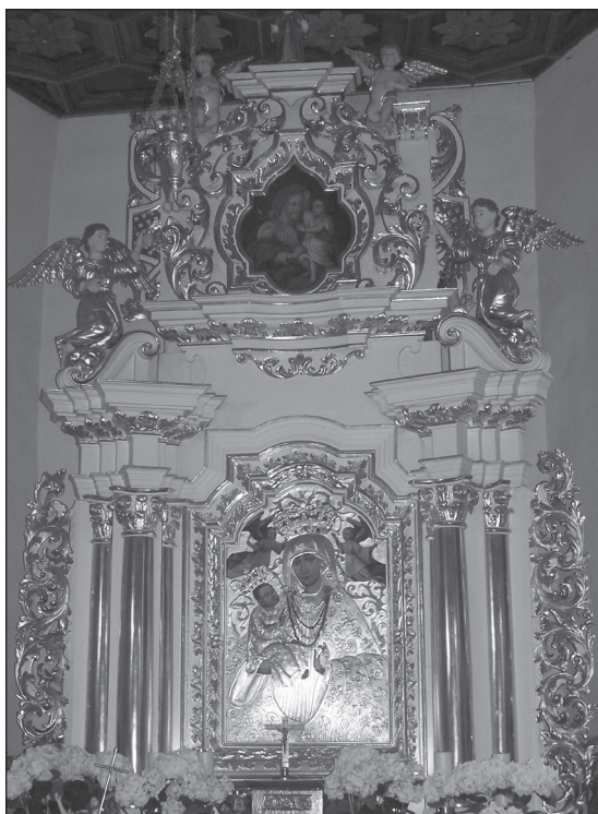
Fot. 3. Kościół parafialny p.w. św. Mikołaja i św. Doroty w Kwiatkowicach, ołtarz główny

główny, oraz wykorzystana w partii wyższej para pilastrów. Głównym elementem zdobniczym jest motyw liści akantu wykorzystany zarówno przy wykonaniu uszu, jak również w obramieniach obrazów umieszczonych w ołtarzu. Obok ornamentu akantowego uwagę zwraca dekoracja uszu w drugiej kondygnacji ołtarza, w których wykorzystano element kratki i taśmy regencyjnej, potwierdzającej wspomniane powyżej datowanie ołtarza.