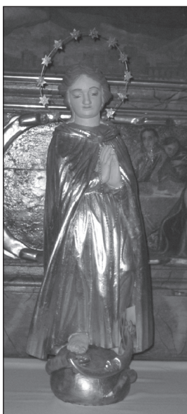
Fot. 6. Kościół parafialny p.w. św. Mikołaja i św. Doroty w Kwiatkowicach, rzeźba Madonna Immaculata

Ponadto w południową ścianę prezbiterium (w łuku tęczowym) wmurowana została tablica erekcyjna z czerwonego marmuru. Pole z inskrypcją obwiedziono bordiurą, w dolnej części pola umieszczono dwa herby: Rola i Jastrzębiec. Tekst wskazuje również na drugą funkcję tablicy 30 , rozumianej jako płyta nagrobna, przez co nadaje ona kościołowi funkcję mauzoleum fundatorów. Opinię taką potwierdza kwestionariusz pochodzący z 26 listopada 1824 r. z kluczowym dla poruszanego zagadnienia pytaniem: Jakie nagrobki w nim [kościół] lub przy nim znajdują się? – Nagrobek w środku kościoła przy prezbiterium w murze [...] z napisem następującym [respondent ankiety przytacza w tym miejscu wspomniany napis z tablicy erekcyjnej] 31 .