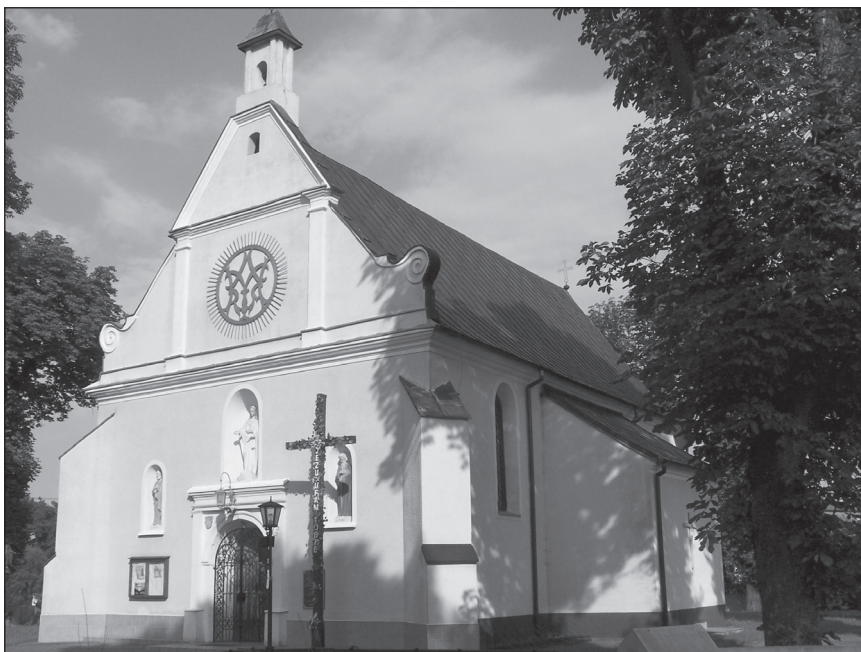
Fot. 1. Kościół parafialny p.w. św. Mikołaja i św. Doroty w Kwiatkowicach

Tytułowy kościół jest budowlą nieorientowaną, zbudowaną z cegły i tynkowaną zarówno wewnątrz, jak i na zewnątrz. Stanowi on przykład jednonawowej świątyni z przylegającym do korpusu węższym, wielobocznie zamkniętym prezbiterium. Od strony północnej przy prezbiterium znajduje się zakrystia, przy korpusie zaś, od strony południowej umieszczono prostokątne pomieszczenie. W planie kościoła dostrzec można podobieństwo do świątyń budowanych z fundacji szlacheckiej od końca średniowiecza na terenie Wielkopolski, ale także muryrowanych obiektów z terenu dawnego archidiakonatu uniejowskiego, w którego granicach w okresie nowożytnym znajdował się omawiany obiekt 8 . Wyraźne podobieństwo wykazują chociażby świątynie w Sobocie i Otorowie o planach stanowiących niemal wierne odbicie planu kościoła kwiatkowickiego 9 . Do grupy świątyń o planie wykazującym liczne podobieństwa zaliczyć można nieco późniejsze niż omawiany obiekty w Drużbinie i Zadzimiu, które jednak, w przeciwieństwie