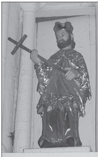
Fot. 7. Kościół parafialny p.w. św. Mikołaja i św. Doroty w Kwiatkowicach, rzeźba św. Jan Nepomucen

Wśród ruchomości pozostających w posiadaniu parafii należy wspomnieć także dwie, pochodzące z początku XVII w., drewniane, polichromowane rzeźby: Madonna Immaculata oraz św. Jan Nepomucen. Pierwsza z nich jest obecnie eksponowana na ołtarzu południowym [fot. 6] 32 , natomiast druga została umieszczona w niszy w południowej ścianie nawy kościoła [fot. 7].