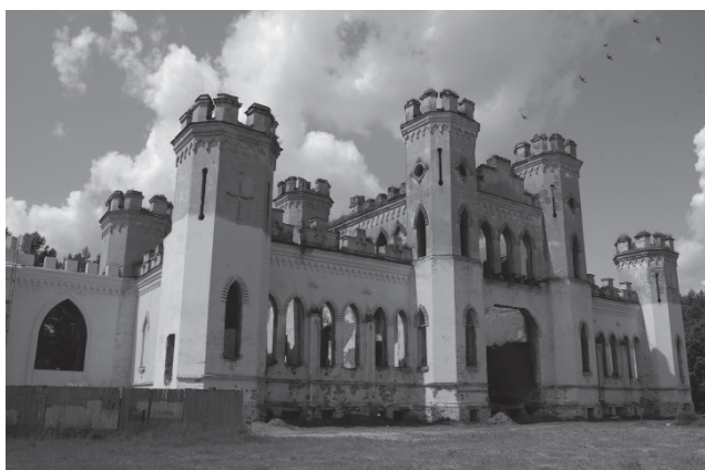
Фот. 2. Косаво. Палац Пуслоўскіх, 40-я гг. XIX ст.