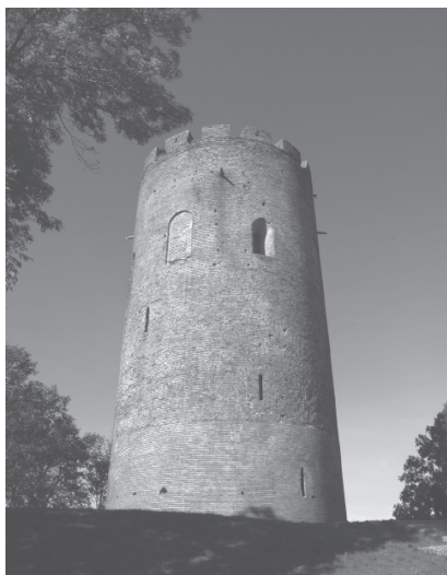
Фот. 1. Камянец. Абарончая вежа, 70-я гг. XIII ст.