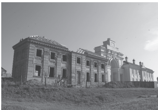
Фот. 3. Ружаны. Уяздная брама ў палац Сапегаў, 70-я гг. XVIII ст.