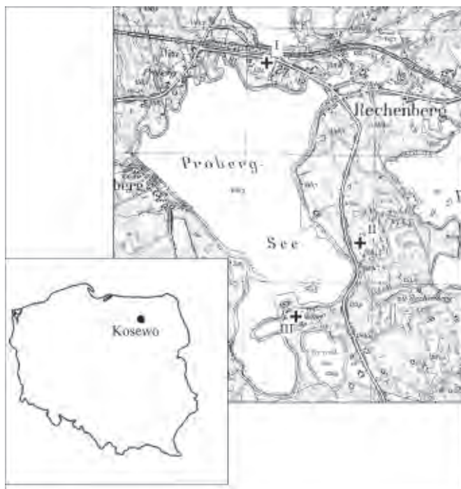
Ryc. 1. Położenie cmentarzyska w Kosewie