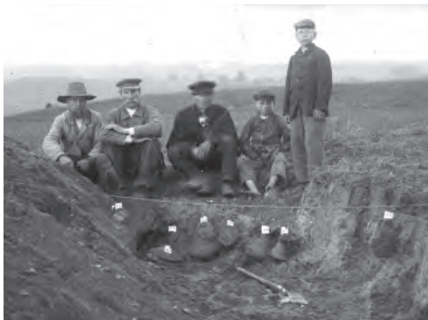
Ryc. 2. Fotografia przedstawiająca robotników zaangażowanych w prace wykopaliskowe na cmentarzysku Kosewo I w maju 1908 r. (Źródło: P-M A 1848/4, fot. prawdopodob. 17.05.1908 r.)